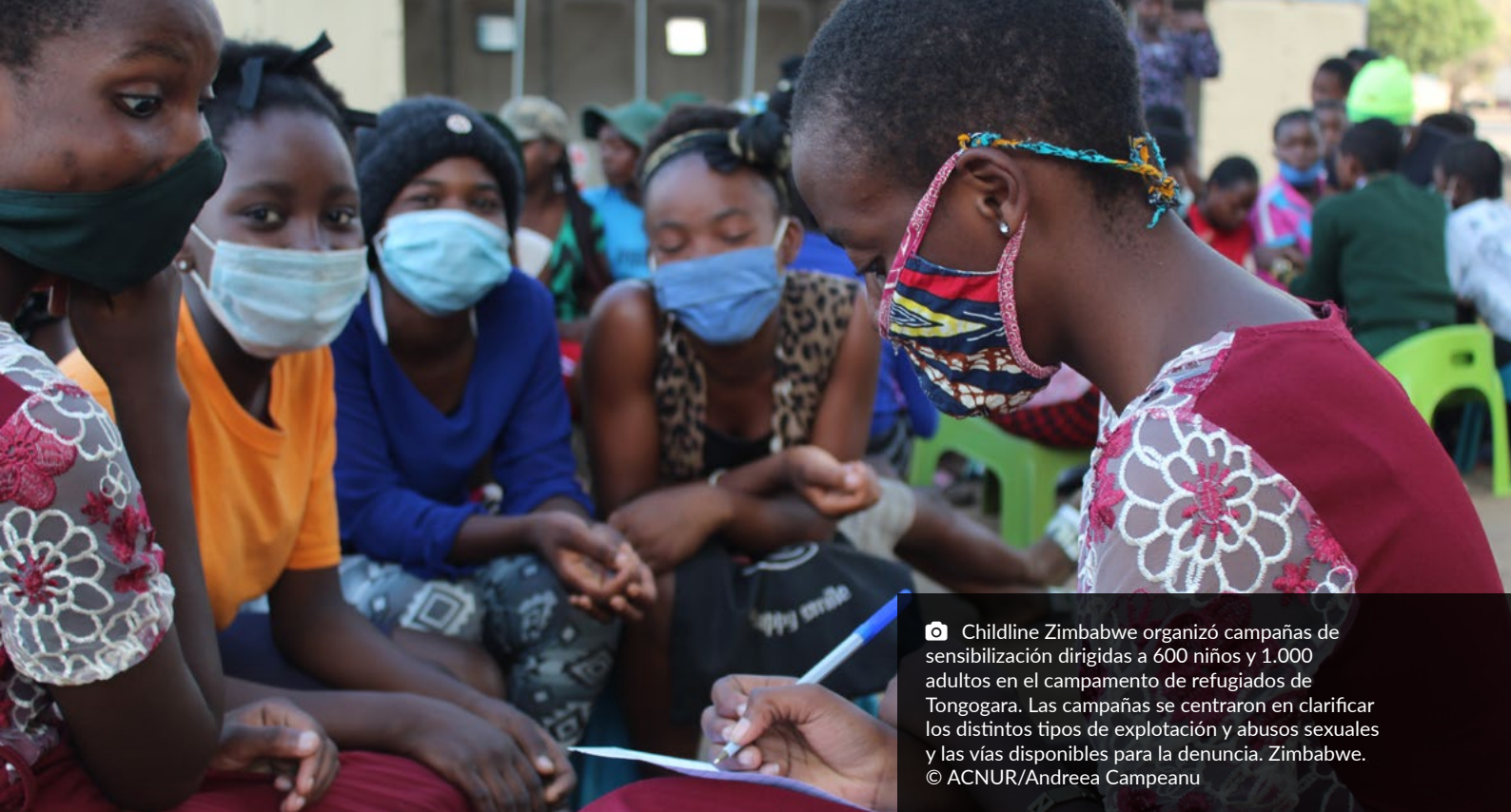
📷 Childline Zimbabwe organizó campañas de sensibilización dirigidas a 600 niños y 1.000 adultos en el campamento de refugiados de Tongogara. Las campañas se centraron en clarificar los distintos tipos de explotación y abusos sexuales y las vías disponibles para la denuncia. Zimbabwe.

abusos sexuales, como la no condicionalidad de la asistencia humanitaria, la denuncia segura y el énfasis en un enfoque centrado en la víctima. En la convocatoria inicial, se recibió la asombrosa cantidad de 1.600 solicitudes, lo que pone de relieve, por un lado, una enorme brecha y, por otro, una extraordinaria capacidad disponible en el ámbito de las iniciativas dirigidas localmente.