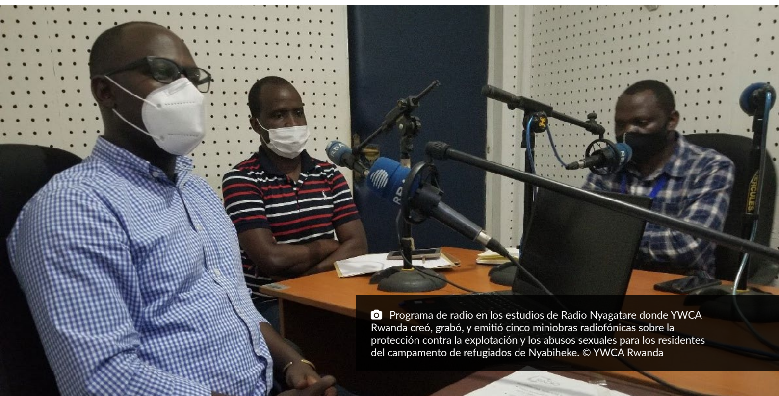
📷 Programa de radio en los estudios de Radio Nyagatare donde YWCA Rwanda creó, grabó, y emitió cinco miniobras radiofónicas sobre la protección contra la explotación y los abusos sexuales para los residentes del campamento de refugiados de Nyabiheke.

El Alto Comisionado continuará su apoyo a este Fondo en 2021, e insta a otros a que hagan lo mismo con el fin de garantizar su sostenibilidad.