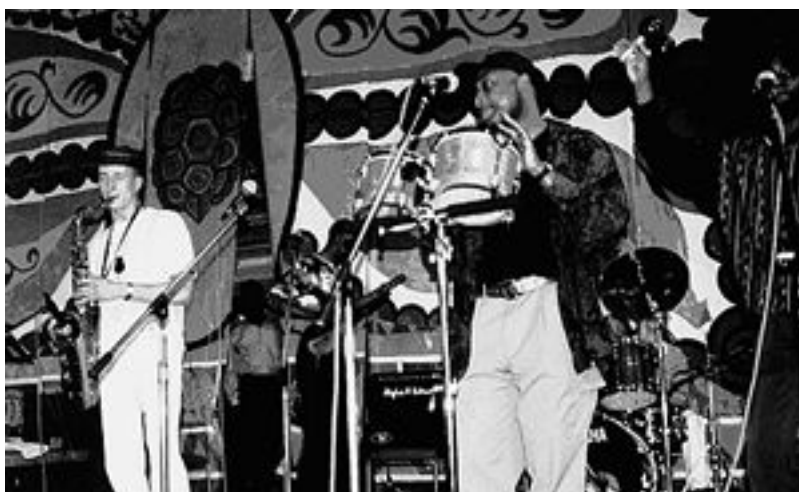
Фото 6: Консультационный центр по Интеграции (CCI) Чешская Республика Проект: «Центры сообществ»

В отношении политики равных возможностей существует несколько различных национальных традиций. Среди многих беженцев, однако, это спорный вопрос. Некоторые считают, что политика равных возможностей – это несколько больше, чем политическая корректность; другие считают, что такая политика – это чисто косметическая мера, которая скрывает продолжающееся внутреннее неравенство между группами меньшинства и остальной частью населения. Более позитивное представление состоит в том, что инициативы по обеспечению равных возможностей создают реальную перспективу внесения большей справедливости и использования талантов для пользы дела, которые в противном случае останутся не полностью востребованными или нераскрытыми. Таким образом, контроль за «равными возможностями» с точки зрения этнического происхождения, не говоря уже о выявлении отдельных беженцев, является сложной проблемой, решение которой сопровождается в разных странах Европы эмоциональными, юридическими и географическими особенностями.