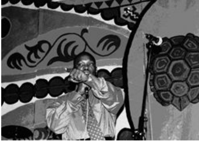
Фото 3: Консультационный центр по Интеграции (CCI) Чешская Республика Проект: «Центры сообществ»