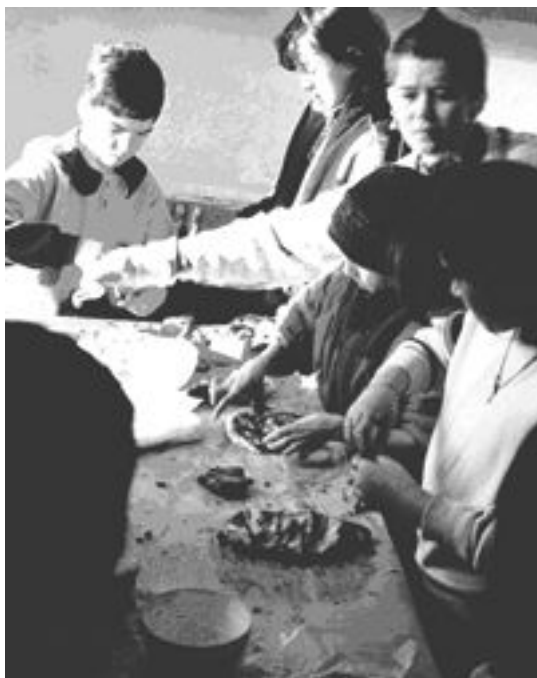
Фото 1: Консультационный центр по Интеграции (CCI) Чешская Республика Проект: «Центры сообществ»