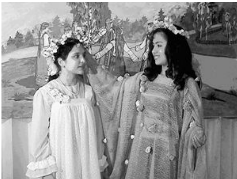
Фото 4: «Экилибр-солидарность» (SOL), Россия Проект: «Общественные центры»