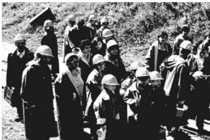
Фото 5: Общество Бьернсона, Словакия Проект: «Интеграция беженцев в регионе Центральной Словакии»