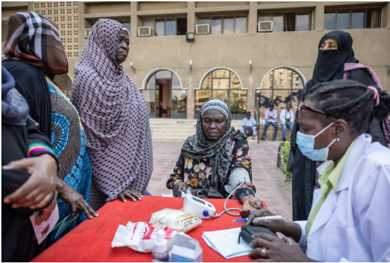
احتفلت كاريناس، الشريك المنفذ للمفوضية، باليوم العالمي للمسنين في ٢٨ أكتوبر بتنظيم يوم حافل بالأنشطة الترفيهية والفحوصات الصحية للكشف عن مرض السكري وارتفاع ضغط الدم.