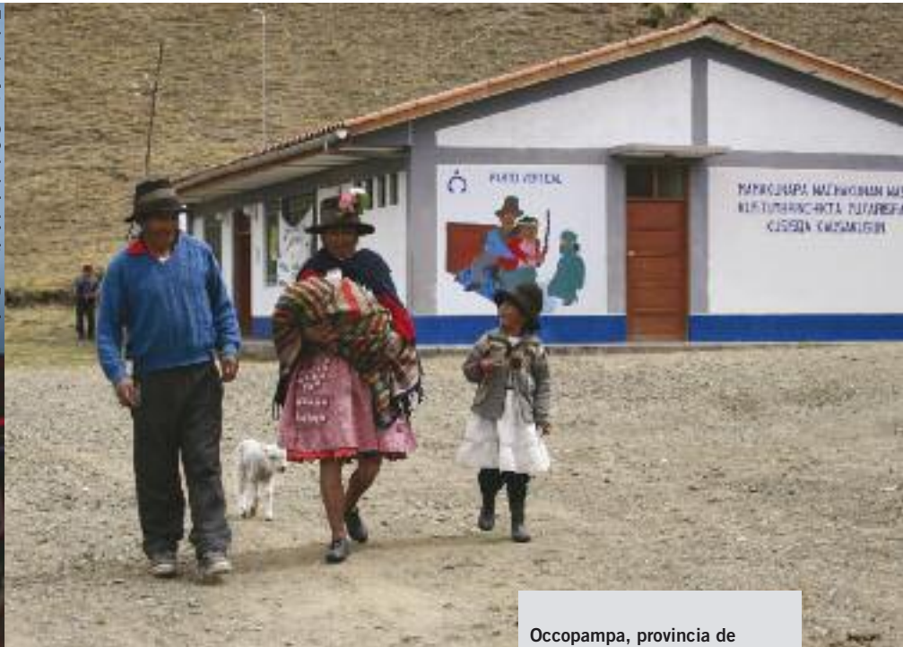
Occopampa, provincia de Churcampa en la región de Huancavelica, junio de 2007. Izquierda: Dar al luz en posición vertical es un método tradicional empleado en el Perú andino. En 2005, el Ministerio de Salud publicó unas directrices sobre el uso de este método para garantizar que los profesionales de la salud ofrecen esta posibilidad a las mujeres. Centro: Antes y después del nacimiento, las mujeres pueden descansar acompañadas de su familia en casas de espera maternas cercanas al centro de salud. Derecha: Una familia abandona el centro de salud de Occopampa con su bebé recién nacido.

personas que viven en la pobreza no tienen acceso a los procesos administrativos que les permitirían conseguir documentos de identidad legales. La falta de documentos oficiales se traduce en la práctica en la restricción del disfrute de derechos civiles y políticos, como el derecho al voto. También niega los derechos sociales y económicos. Por ejemplo, limita el acceso al Seguro Integral de Salud (SIS), el programa de salud pública que permite a las mujeres que viven en la pobreza acceder a servicios gratuitos de atención de la salud materna, porque para inscribirse en el SIS son necesarios documentos de identidad. Según el censo de comunidades indígenas de 2007, el 14,9 de la población mayor de 18 años censada no tenía documentos de identidad peruanos. Este porcentaje era superior en el caso de las mujeres (18,1 por ciento) que en el de los hombres (12,2 por ciento). 42