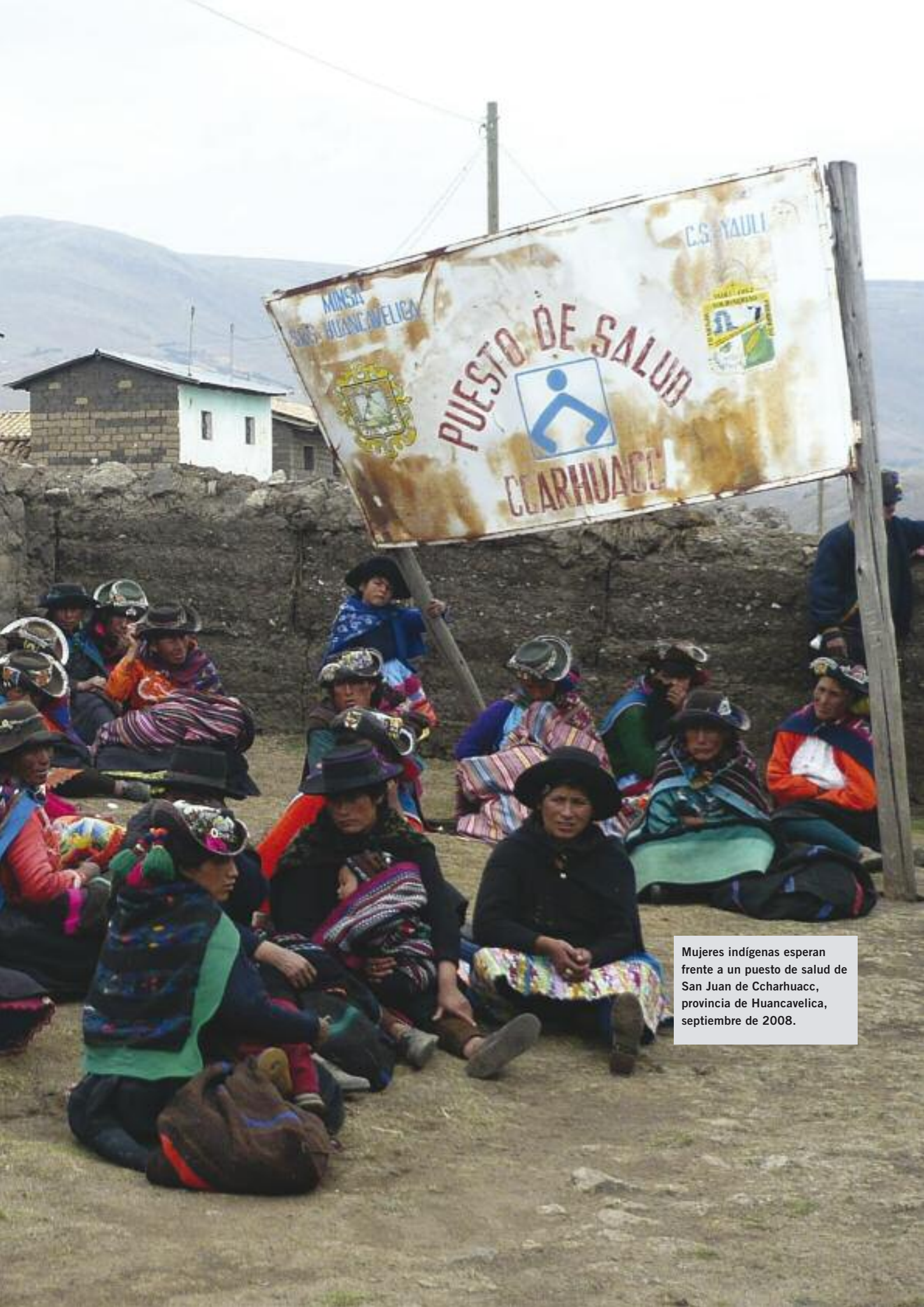
Mujeres indígenas esperan frente a un puesto de salud de San Juan de Ccharhuacc, provincia de Huancavelica, septiembre de 2008.