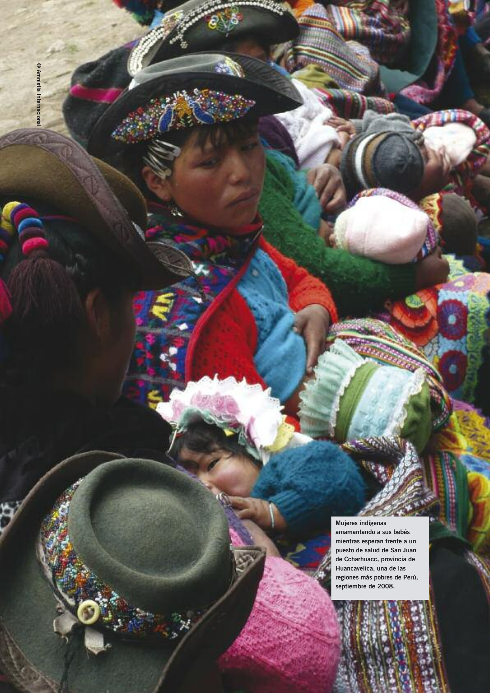
Mujeres indígenas amamantando a sus bebés mientras esperan frente a un puesto de salud de San Juan de Ccharhuacc, provincia de Huancavelica, una de las regiones más pobres de Perú, septiembre de 2008.