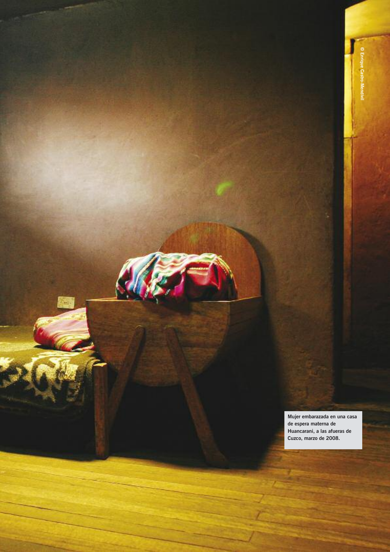
Mujer embarazada en una casa de espera materna de Huancarani, a las afueras de Cuzco, marzo de 2008.