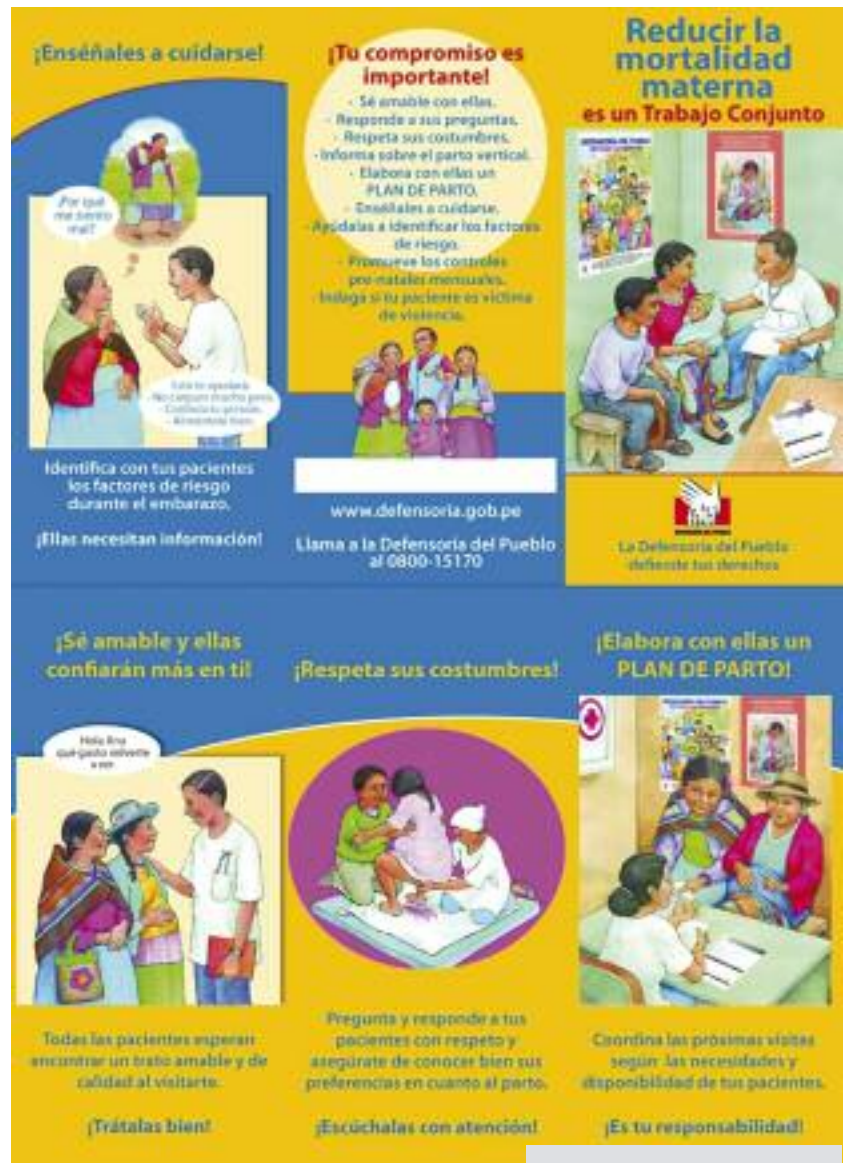
Folleto editado por la Defensoría del Pueblo y dirigido a los profesionales de la salud en el que se les informa de los derechos de las usuarias y cómo interactuar con eficacia de manera que se reduzca la mortalidad materna.

Respecto al método de parto vertical, 55 el informe de 2008 de la Defensoría afirmó que el 80 por ciento de los centros de salud rurales visitados que estaban obligados a proporcionar instalaciones para parto vertical las ofrecían. Esto demostraba un avance en la adaptación cultural de los establecimientos de salud públicos. Sin embargo, los profesionales de la salud y las organizaciones no gubernamentales dijeron a Amnistía Internacional que la formación en esta técnica aún no está suficientemente extendida. El informe de la Defensoría señalaba asimismo que el 13,8 por ciento del personal entrevistado que debería haber conocido esta técnica no estaba al tanto de las directrices sobre parto vertical, y que más del 45 por ciento afirmó no haber recibido ninguna formación para aplicarla. 56