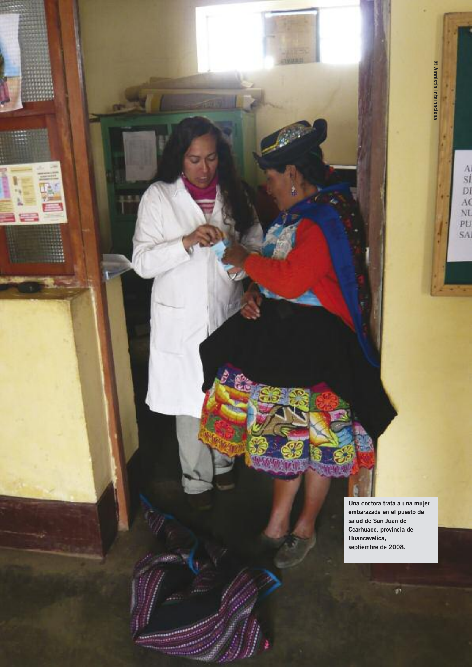
Una doctora trata a una mujer embarazada en el puesto de salud de San Juan de Ccarhuacc, provincia de Huancavelica, septiembre de 2008.