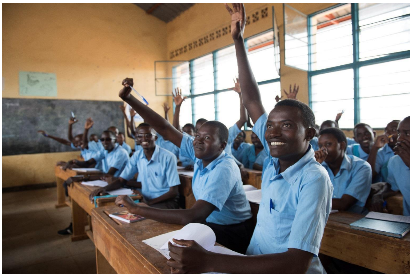
Refugiados de Burundi y miembros de la comunidad local de acogida de Ruanda estudian uno al lado del otro en la escuela Paysannat en el este de Ruanda.