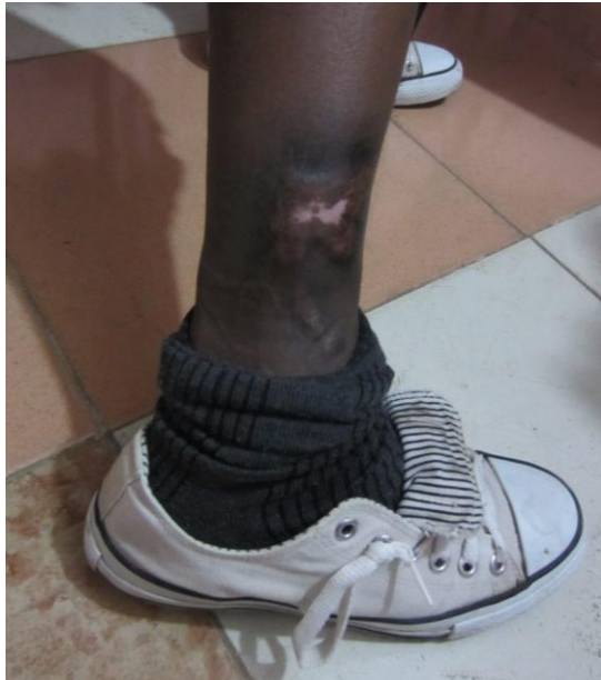
ዓንካር-ዓንካራቶ ወዲ 17 ዓመት ኤርትራው ነቲ ኣብ ሲናይ ብኣሰገርቲ ንሸግግጥ ኣዋርሕ ብናይ ሰንሰለት መቐሕ ድሕሪ ምእሳሩ ኣብ ኣካላቱ ዘተረፈ በሰላ ዘርኢ።

እዚ መንእሰይ'ዚ ቤተሰቡን ኣዝማዳን 27 ሸሕ ዶላር ምስ ክፈሉሉ ናጻ ዘተለቀቀ መንእሰይ እዩ። እዋርሕ ድሕሪ ምፍቱሑ፡ ኣብ ከባቢ ዓንካር-ዓንካራቶኡ ዝረአዩ በሰላታት ከአ ኣብ ሲናይ ንሸግግጥ ኣዋርሕ ብናይ ሰንሰለት ሞቓሕ ከምዝተሓሰረ ዝሃቦ ቃለ-ምስክርነት ዘረጋግጹ ህያው ምስክር እዮም።