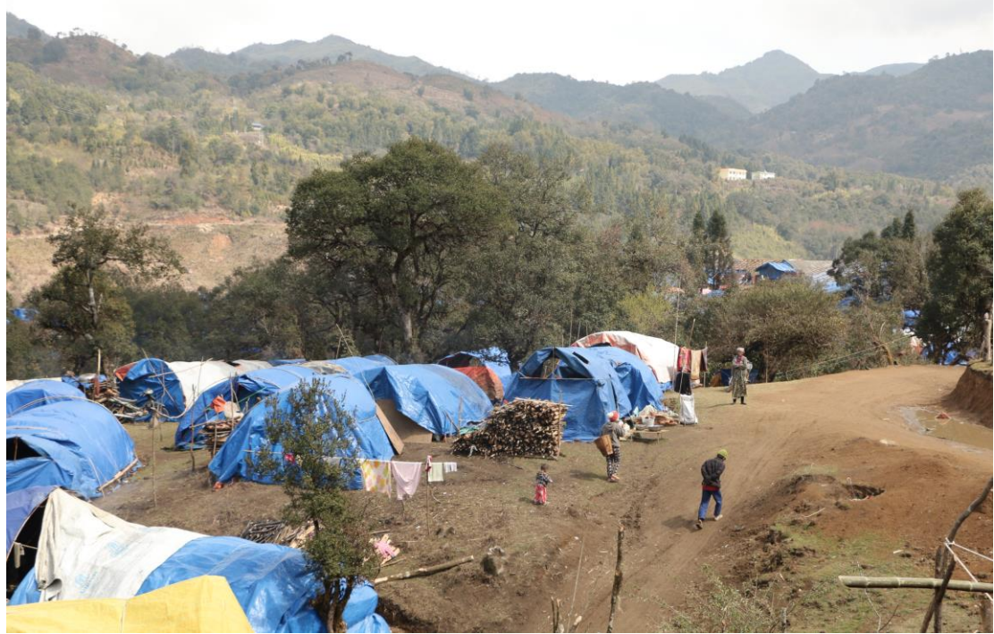
၁၈၅ ↑ တိုက်ပွဲများမှ ထွက်ပြေးလာရသော လူ ၂၀၀၀ ကျော်နေထိုင်နေသည့် ရှအစ်ယန် စစ်ရှောင်ဒုက္ခသည်စခန်း

အကူအညီပေးရန် သွားရောက်ခွင့်ကို တားမြစ်ထားခြင်းသည် စစ်ရှောင် ဒုက္ခသည်များလိုအပ်သော နေစရာ၊ သောက်သုံးရေနှင့် သန့်ရှင်းရေးတို့အတွက် အလျင်အမြန် ဆောင်ရွက်ပေးနိုင်ရေးတွင် အခက်အခဲလေးခု ဖြစ်ပေါ်စေသည်ဟု ကူညီကယ်ဆယ်ရေး ဆောင်ရွက်ပေးနေသူများက ပြောပြကြသည်။ ပထမအချက်မှာ တားမြစ်ထားမှုကြောင့် သစ်နှင့် ဝါးကဲ့သို့သော ပစ္စည်းများကို အစိုးရထိန်းချုပ်ရာ မဟုတ်သည့်ဒေသများသို့ သယ်ယူရန်အခက်အခဲ ရှိသည်။ ဒုတိယအချက်မှာ နိုင်ငံတကာအဖွဲ့အစည်းများကို တားမြစ်ထားသဖြင့် ကူညီကယ်ဆယ်ရေးလုပ်ငန်းများမှာ ဒေသခံအဖွဲ့ အနည်းငယ်အပေါ် သို့ ကျရောက်သွားပြီး များပြားလှသော လိုအပ်ချက်များကို မဖြည့်ဆည်းပေးနိုင်ပဲ ဖြစ်ရသည်။ တတိယအချက်မှာ နိုင်ငံတကာ အဖွဲ့အစည်းများက ဒေသခံအဖွဲ့အစည်းများကို ငွေကြေးထောက်ပံ့ပြီး ရေပိုက်များသွယ်ခြင်း၊ အိမ်သာဆောက်ခြင်းစသည့် လုပ်ငန်းများ လုပ်ဆောင်ရန် ကူညီညွှန်ကြားပေးနိုင်သော်လည်း ယင်းလုပ်ငန်းများ အရည်အသွေးပြည့်မီခြင်း ရှိအောင် စစ်ဆေးကြပ်မတ်ပေးနိုင်ခြင်း မရှိတော့ပါ။ ၁၈၇ နေရာသို့ မသွားရောက်နိုင်ခြင်းကလည်း အကာအကွယ်ပေးနိုင်ရန် စောင့်ကြည့်ခြင်းကို ထိခိုက်စေပါသည်။ “အခြေအနေကို အကဲဖြတ်နိုင်ဖို့ အခက်အခဲရှိပါတယ်။ နေရာမှာရှိနေပြီး အကာအကွယ်ပေးနိုင်ဖို့က အရေးကြီးပါတယ်” ဟု နိုင်ငံတကာကူညီရေး ဝန်ထမ်းတစ်ဦးက ပြောသည်။ “အဲဒီလိုနေဖို့က တရားဝင်ခွင့်ပြုချက် ရရပါမယ်။” ၁၈၈