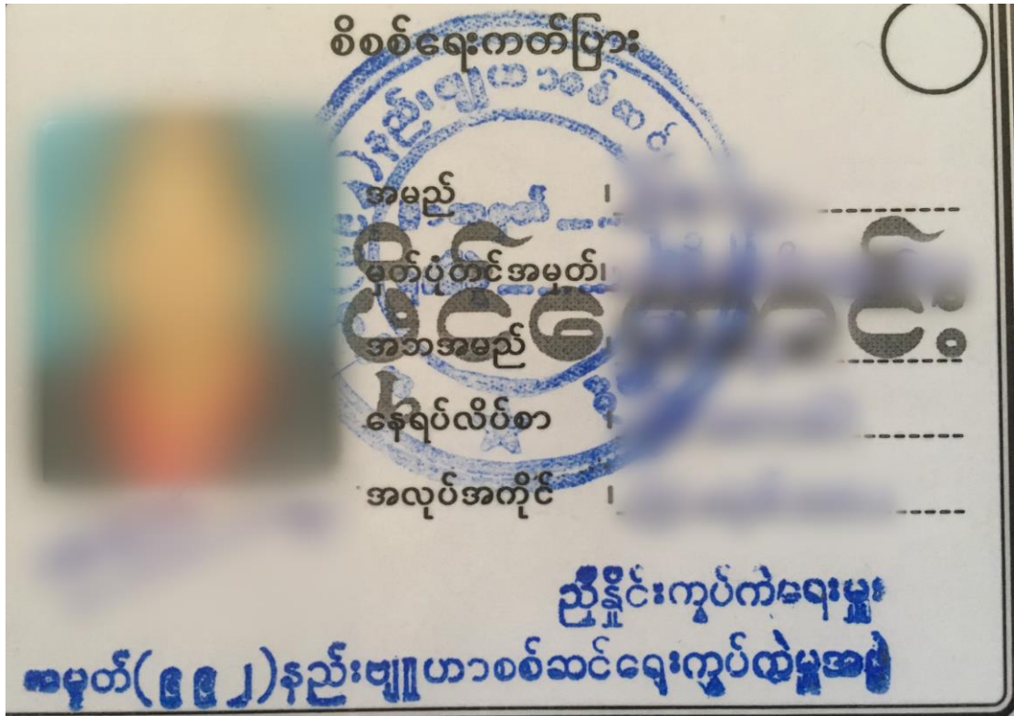
၉၅ ↑ ပန်ဆန်းနှင့် မုံကိုးအကြားရှိ ရွာများမှ ရွာသားများကို မြန်မာအာဏာပိုင်များက ၂၀၁၇ ခုနှစ် နှစ်ဆန်းတွင် ထုတ်ပေးသော အထူး သက်သေခံကတ်ပြား၊ ကတ်ပြားမပါပဲ စခန်းအပြင်ဖက် အိမ်အပြင်ဖက်တွင်တွေ့ရပါက မည်သူမဆို မြန်မာလုံခြုံရေးတပ်ဖွဲ့များ၏ ဖမ်းဆီးခြင်း ခံရနိုင်ပါသည်။ ၉၆ အပြည်ပြည်ဆိုင်ရာ လွတ်ငြိမ်းချမ်းသာခွင့်အဖွဲ့