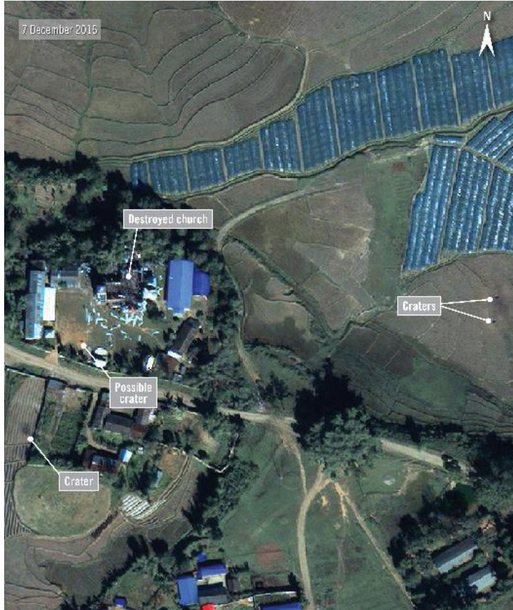
၂၀၁၆ ဒီဇင်ဘာလ ၇ ရက်နေ့က ရိုက်ယူထားသော ပုံတွင် မိုးကြိုးတွင် ပျက်စီးသွားသော ဘုရားကျောင်းတစ်ခုကို တွေ့ရသည်။ ဘုရားကျောင်းအနီးရှိ ကွင်းတွင်လည်း အပေါက်ကြီးများကို တွေ့နိုင်သည်။ မိုးဒဏ်ကြောင့် ဖြစ်နိုင်သည့် အပေါက်ကြီးတစ်ခုကိုလည်း ဘုရားကျောင်းဝင်းထဲတွင် တွေ့နိုင်သည်။ မြေပုံညွှန်း - ၂၄.၁၀၁၃၊ ၉၈.၃၂၀၆