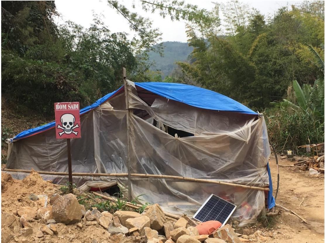
၂၉၁ ၊ အပြည်ပြည်ဆိုင်ရာ လွတ်ငြိမ်းချမ်းသာခွင့်အဖွဲ့၊ အင်တာဗျူးများ၊ လားရှိုး နှင့် ရန်ကင်း၊ မေ ၂၀၁၇။ ၂၉၂ ၊ အပြည်ပြည်ဆိုင်ရာ လွတ်ငြိမ်းချမ်းသာခွင့်အဖွဲ့၊ စတုဂံအင်တာဗျူး၊ နေရာ မဖော်ပြလိုပါ။ ၁၈ မေ ၂၀၁၇။ ၂၉၃ ၊ အပြည်ပြည်ဆိုင်ရာ လွတ်ငြိမ်းချမ်းသာခွင့်အဖွဲ့၊ အင်တာဗျူး၊ နေရာ နှင့် နေ့စွဲ မဖော်ပြလိုပါ။

တိုက်ပွဲများပြီးသွားလျှင် သို့မဟုတ် ၎င်းတို့ ယင်းဒေသမှ ထွက်ခွာသွားလျှင် ချထားသော မိုင်းများ ရှင်းပေးခဲ့မည်ဟု မြန်မာစစ်တပ်ရော တိုင်းရင်းသား လက်နက်ကိုင်အဖွဲ့များကပါ ကတိပြုကြသည်ဟု ရပ်ရွာလူကြီးများက ပြောပြသည်။ မကြာခင်ဆိုသလိုပင် အဖွဲ့များအချင်းချင်း တိုက်ပွဲများဖြစ်လာသည့်အခါ ရုတ်တရက် တပ်နေရာများရွှေ့ပြောင်းကြရ သဖြင့် မိုင်းများကို မရှင်းလင်းပဲ ချန်ခဲ့ကြသည်။ မိုင်းချရာနေရာများကို အမှတ်အသားလုပ်ရန် ပျက်ကွက်ခြင်း သို့မဟုတ် မှတ်သားမှု အားနည်းခြင်းကြောင့်လည်း စစ်သားများက ၎င်းတို့ချထားသော မိုင်းများ၏ နေရာကို မမှတ်မိခြင်းမျိုးလည်း ရှိသည်။