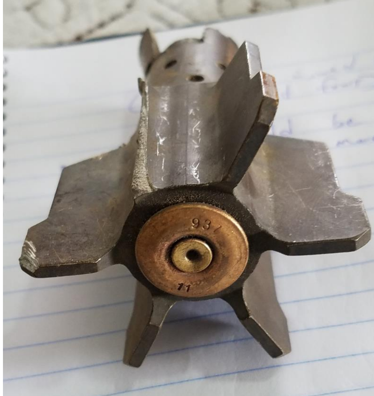
← (၉) ၂၀၁၇ ခုနှစ် ဇန်နဝါရီလ ၁၂ ရက်နေ့က ရှမ်းပြည်မြောက်ပိုင်းရှိ ဟိုချောင်ရွာထဲသို့ ကျရောက်ပေါက်ကွဲခဲ့သော မော်တာကျည်ဆံ၏ အမြီးပိုင်း

မော်တာကျည်ဆံများ ထိမှန်သဖြင့် လက်နှင့် ခြေထောက်မှာ ပြင်းထန်စွာ ဒဏ်ရာရသွားသော အသက် ၂၆ နှစ်အရွယ်အမျိုးသမီးက “ဒါမျိုး နောက်ထပ် မဖြစ်စေချင်ပါဘူး၊ သူတို့ ငြိမ်းချမ်းရေးအတွက် ဆွေးနွေးဖို့ လမ်းရှာနိုင်ကြရင်ကောင်းမယ်။ ကျွန်မတို့က ရွာသားတွေပါ၊ ကျွန်မတို့ပဲ ခံရတာပဲ။” ၁၂၆ 126 ဟု အပြည်ပြည်ဆိုင်ရာ လွတ်ငြိမ်း ချမ်းသာခွင့်အဖွဲ့ကို ပြောပြသည်။