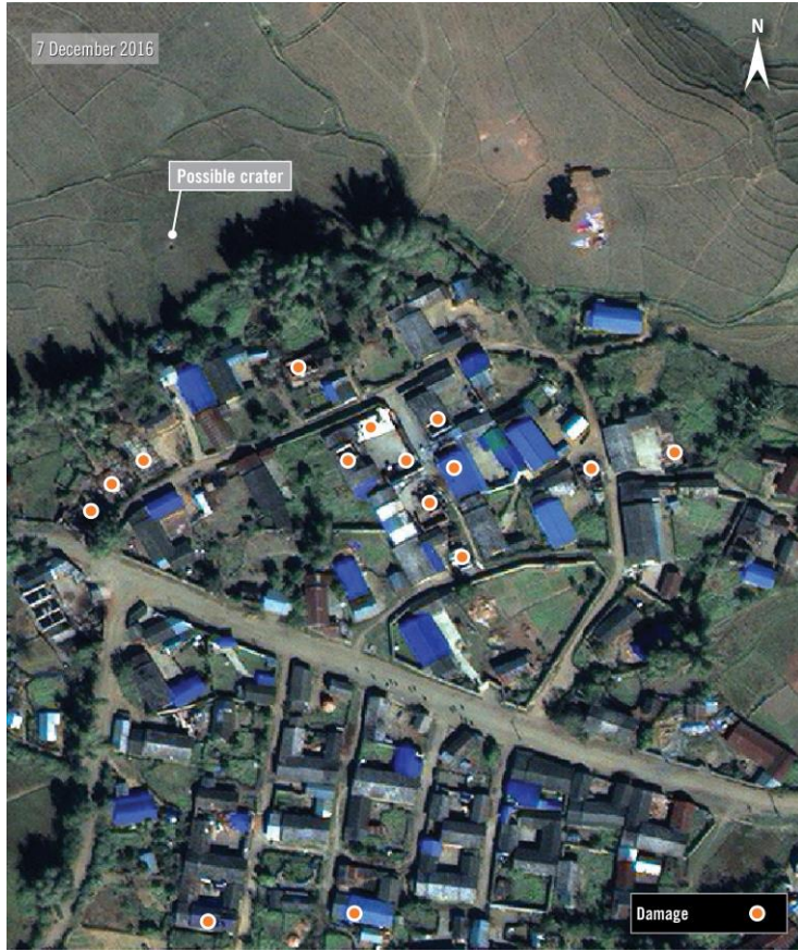
၂၀၁၆ ဒီဇင်ဘာလ ၇ ရက်နေ့က ရိုက်ယူထားသော ပုံတွင် မိုးကိုးတွင် ထိခိုက် ပျက်စီးသွားသော အဆောက်အဦများကို လိမ္မော်ရောင် အစက်များဖြင့် ပြထားသည်။ ပျက်စီးနေသော အဆောက်အဦများ၏ အနောက်မြောက်စက်ရှိ ကျင်းတစ်ကျင်းထဲတွင် မိုးဒက်ကြောင့် ဟုယူဆနိုင်စရာ ကျင်းတစ်ကျင်းကိုလည်း တွေ့ ရသည်။ အပျက်အစီးများနှင့် ကျင်းတို့မှာ လွန်ခဲ့သည့်တစ်လခန့်က ဖန်ခဲ့ပါ။ ဖြေပုံညွှန်း - ၂၄.၀၉၉၆° ၉၈.၃၂၇၇°