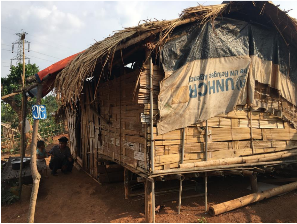
© ↑ ရှမ်းပြည်မြောက်ပိုင်း နယ်တူမြို့နယ်အပြင်ဖက်ရှိ စစ်ရှောင်ခိုကွယ်သည်စခန်းတစ်ခုမှ နေအိမ်တစ်လုံး၊ ၂၀၁၇ ခုနှစ်မေလအတွင်း အနီးအနားဒေသတွင် တိုက်ပွဲများ ပြင်ထန်မှုကြောင့် ဖမ်းစခန်းမှ လူအများအပြား အနားပတ်ဝန်းကျင်ရွာများသို့ ထွက်ပြေးတိမ်းရှောင်ခဲ့ရသည်။ © အပြည်ပြည်ဆိုင်ရာ လွတ်ငြိမ်းချမ်းသာခွင့်အဖွဲ့

“ဆရိယာများ အားလုံး ခုကွ မိတားကြိုရ” မြန်မာနိုင်ငံ မြောက်ပိုင်းတွင် ဖြစ်ပွားနေသော ပဋိပက္ခ၊ အိုးအိမ်စွန့်ခွာ ထွက်ပြေးရမှုများ နှင့် လူ့အခွင့်အရေးဆိုင်ရာဖောက်ဖျက်မှုများ အပြည်ပြည်ဆိုင်ရာ လွတ်ငြိမ်းချမ်းသာခွင့်အဖွဲ့