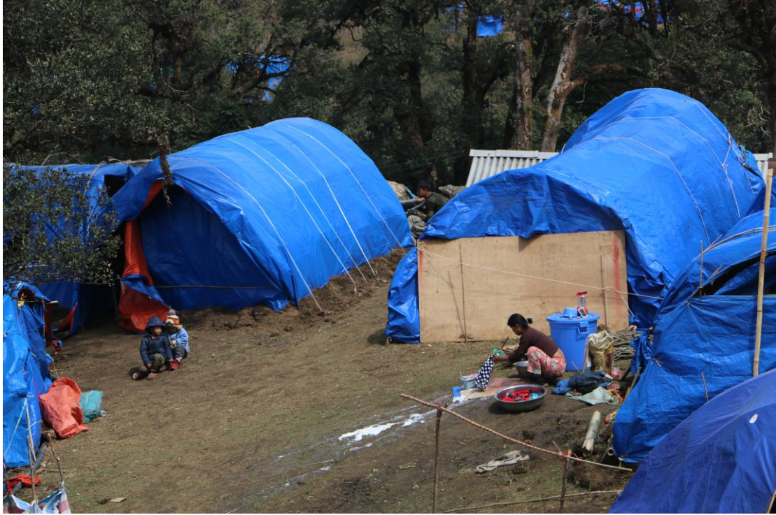
၉၁၅ ၊ ၎်ရှောင်ဒုက္ခသည် ၂၀၀၀ ကျော်နေထိုင်လျက်ရှိသော ရှအပ်ယန် စခန်း၊ ရှအပ်ယန်ကို ရောက်လာသူအများစုမှာ ယခင်က ဇိုင်း အောင်စခန်းတွင် နေခဲ့ကြသူများ ဖြစ်ပြီး ၂၀၁၆ခုနှစ် ဒီဇင်ဘာ ၂၇ ရက်နေ့က မြန်မာစစ်တပ်မှ ပစ်ခတ်သော မော်တာ ကျည်များ စခန်းအနီးတွင် ကျရောက်ပေါက်ကွဲပြီးသည့်နောက် ထွက်ပြေးလာကြသူများဖြစ်သည်။ ၉၁၅ အပြည်ပြည်ဆိုင်ရာ လွတ်ငြိမ်းချမ်းသာခွင့်အဖွဲ့