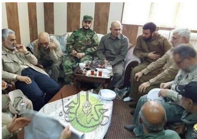
Imagen V El General Soleimani en la “sala de operaciones de Faluya”

Fuente: Agencia de noticias Fars, foto publicada el 25 de mayo de 2016 con la siguiente leyenda: “Iraqi Harakat Hezbollah al-Nujaba media group published photos of popular forces operations room showing Iran’s Quds Force Commander Major General Qassem Soleimani discussing Faluya battle strategies with Badr commander Hadi Al-‘Amiri, Nujaba’s Akram Al-Ka’abi and another popular fighters’ commander, Abu Mahdi Al-Muhandis”, el General Soleimani se encuentra en la extrema izquierda.