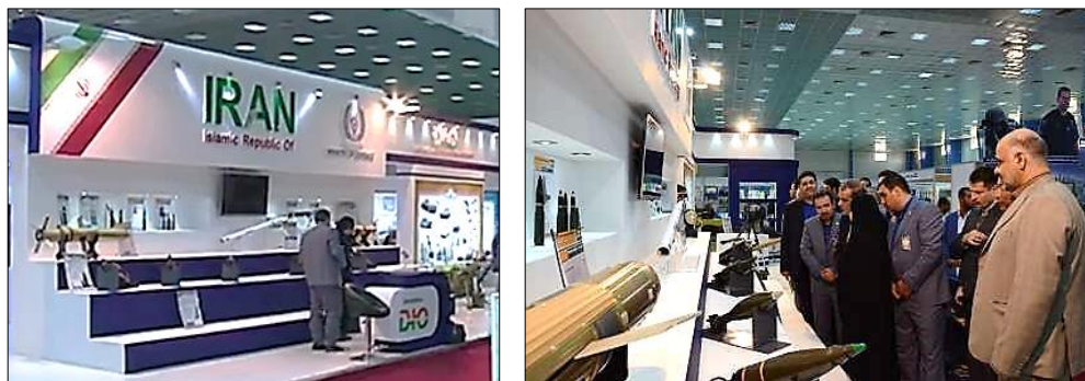
图三 伊朗实体在第五届伊拉克防务展期间展出的物项