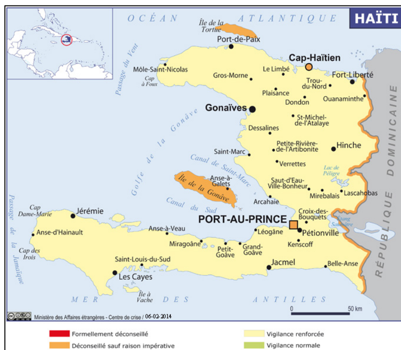
Géographie de l'insécurité en Haïti

Les phénomènes liés à la criminalité touche également le département du Sud, bien que, selon des officiels de la Police nationale haïtienne, la situation n'est pas comparable avec celle prévalant dans le Département de l'Ouest et dans la zone métropolitaine de Port-au-Prince. Certaines communes du département semblent être plus touchées que d'autres dont Camp-Perrin, Aquin, Saint-Louis du Sud, Coteaux et Les Anglais 22 .