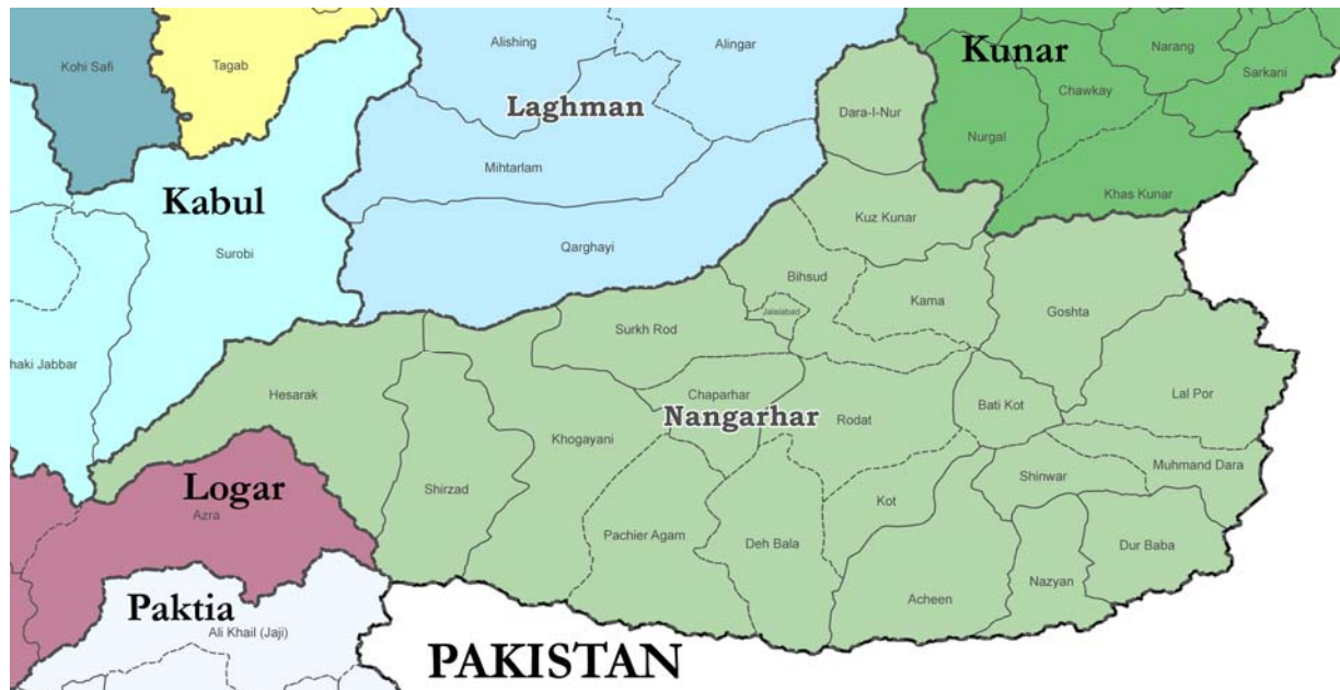
Abb. 2: Provinz Nangarhar mit Distrikten 53

Die Provinz Nangarhar liegt im Osten Afghanistans. Sie ist in 22 Distrikte aufgeteilt und mit einer Gesamtfläche von 7'616 km 2 etwas grösser als der Kanton Graubünden (7'105 km 2 ). Nach offiziellen Angaben zählt die Provinz rund 1'360'000 Einwohner. 54 Der Hauptort Jalalabad ist mit schätzungsweise über 200'000 Einwohnern die fünftgrösste Stadt in Afghanistan. Sie liegt in einer breiten, fruchtbaren Ebene, wo die Flüsse Laghman, Surkh Ab und Kunar in den Kabul fließen. 55