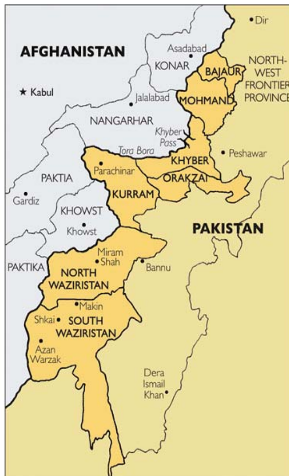
Abb. 4: Karte der FATA 81