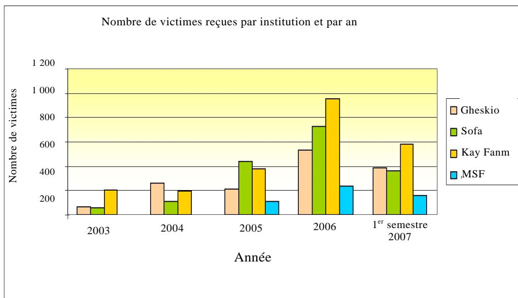
Figure 1 Nombre de victimes reçues par institution et par an, entre 2003 et 2007*

Sources : Rapports Gheskio, Sofa, Kay Fanm et MSF/F