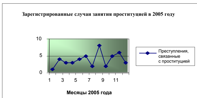
Таблица 6.2. Зарегистрированные случаи занятия проституцией в 2005 году 41