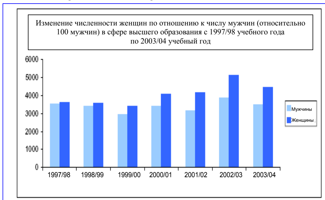
Диаграмма 10.1. Высшее образование