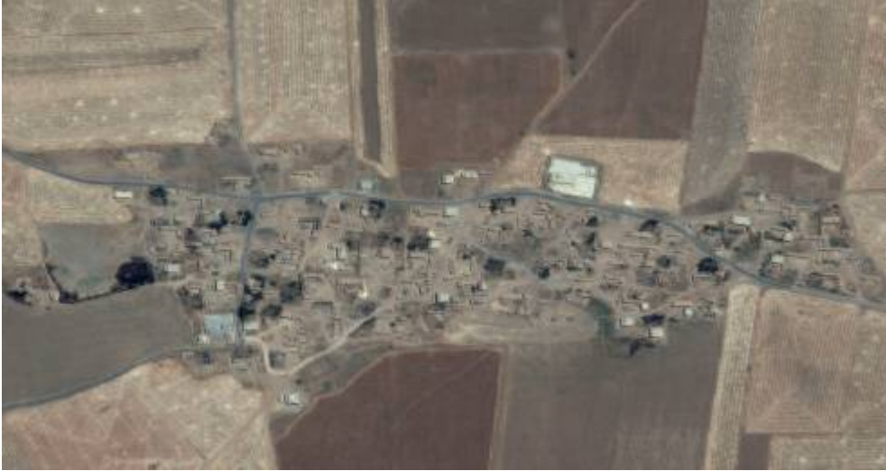
الصورة الملتقطة بالأقمار الصناعية للحسينية في يونيو/ حزيران 2014

2015 وقامت المنظمة بتحليلها وجود 225 مبنى في 2014 بقي منها 14 مبنياً فقط في عام 2015، أي أن عدد المباني قد تقلص بواقع 93.8% خلال عام واحد فقط. ومن خلال هذه الصور، فيمكن القول أن الانقراض ناجمة عن عملية هدم للمنازل وليس قصفاً مدفعياً لها. وقال سكان القرية أن وحدات الحماية الشعبية هي التي قامت بعملية هدم المنازل في فبراير/ شباط 2015، ما تسبب بنزوح الأهالي إلى القرى القريبة ومدينة القامشلي. وظل بعض سكان الحسينية يقيمون في مبنى مدرسة القرية الذي لم تتم إزالته.