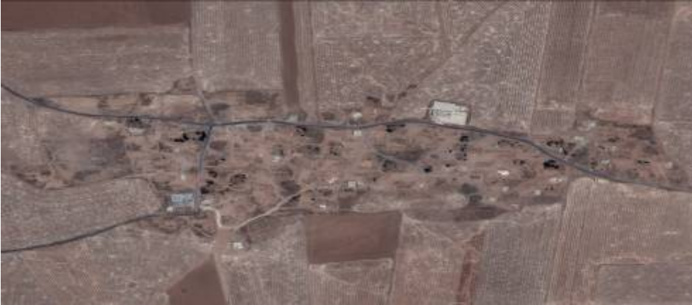
الصورة الملتقطة بالأقمار الصناعية للحسينية في يونيو/ حزيران 2015 تبين أن القرية تقريبا بأكملها تم هدمها.