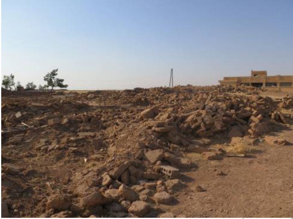
أنقاض نحو 90 منزلاً جرى هدمها في قرية الحسينية.

زارت منظمة العفو الدولية قرية الحسينية التي يقطنها العرب في ريف تل حميس أوائل شهر أغسطس / آب 2015. وأخبر القرويون باحثي المنظمة أن ما يقرب من 90 منزلاً قد جرى هدمها، أي جميع منازل القرية، خلا أحدها كان لا زال قائماً. وشاهد باحثو منظمة العفو الدولية أنقاض المنازل التي جرى هدمها أثناء زيارتهم للقرية. وتُظهر الصور الملتقطة بالأقمار الصناعية للحسينية ما بين يونيو / حزيران 2014 والشهر نفسه من عام