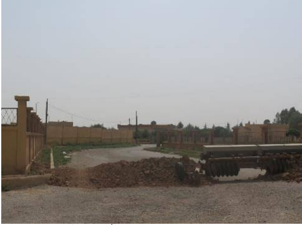
مدخل قرية حمام التركمان وقد وضعت وحدات الحماية الشعبية حاجز ترابي أمامه، 30 يوليو / تموز 2015.

وأما في قرية حمام التركمان القريبة، فلقد قام عناصر وحدات الحماية الشعبية بجمع سكانها داخل المدرسة وأخبروهم بضرورة مغادرة القرية.