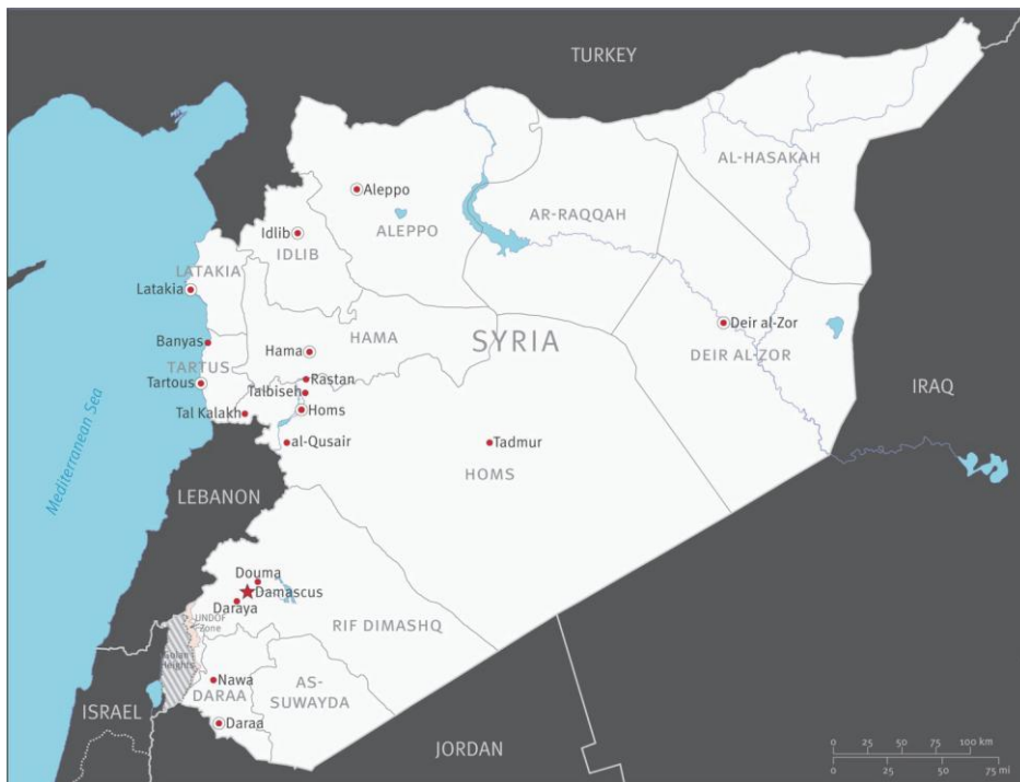
Karte Syriens: Human Rights Watch 77

Besonders betroffen von den Unruhen und den anschließenden Repressionsmaßnahmen des Staates waren bisher die mehrheitlich von Sunniten bewohnten Provinzen: Dera'a (Dar'a), Rif Dimashq (Umgebung von Damaskus), al-Hassakeh (al-Hasakah), Homs (Hims), Hama (Hamah) und Idlib.