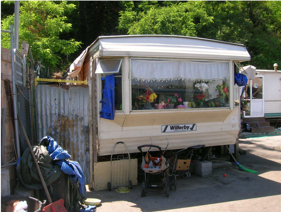
Una casa mobile nel campo Candoni, giugno 2013. Quando il campo Casilino 900 fu chiuso, nel 2010, un centinaio dei suoi residenti furono trasferiti a Candoni, dove attualmente sono alloggiate un totale di circa 900 persone.