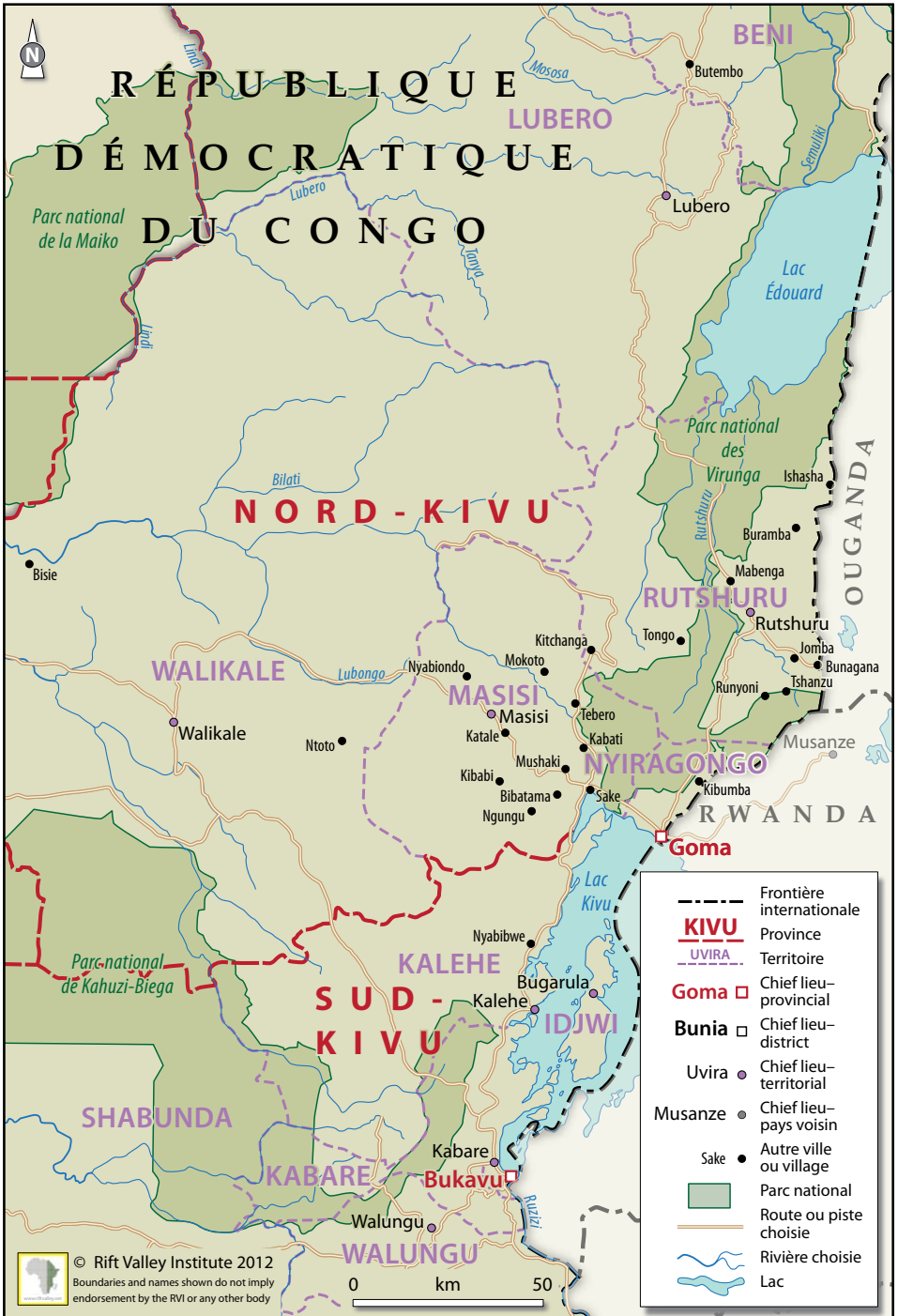
Map 2. Nord-Kivu, montrant les territoires du Petit-Nord