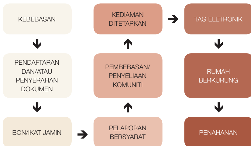
Gambarajah 2 66