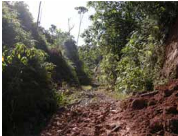
Fotografía 3 (Ingreso a los resguardos hasta dónde va la carretera).