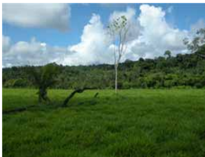
Fotografía 20 (Contraste de la tierra intervenida y la que se conserva).