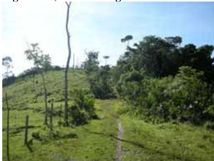
Fotografía 2 (Ingreso a los resguardos hasta dónde va la carretera).