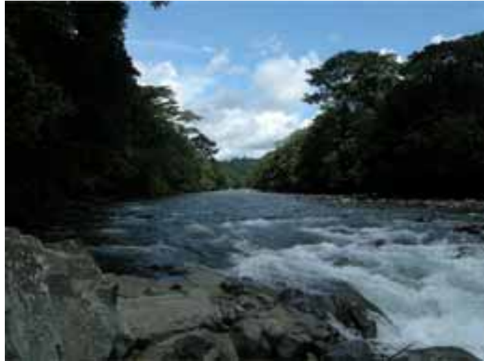
Fotografía 6 (Río Tolo).

“(…) la carretera retomaría el curso dentro de la zona del resguardo pasando por encima del río Tolo a través de un puente que cruzaría en las partes que constan en las fotografías 62 a 65 de la carpeta 4. Luego, la carretera atravesaría la zona de explotación ganadera del referido colono Torres en sentido occidente sur-oriente para después en forma de U orientarse al norte. Si ello es así, es evidente que buena parte de viviendas del resguardo e incluso la escuela deberían ser reubicadas; al respecto pueden observarse las fotografías 26,32, 33, 39, 40, 41, 42, 48 y 51.” 80