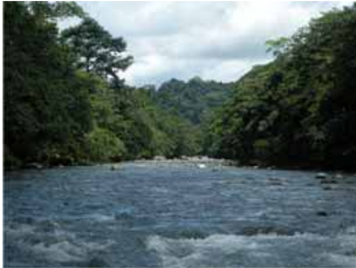
Fotografía 11 (Río Tolo).