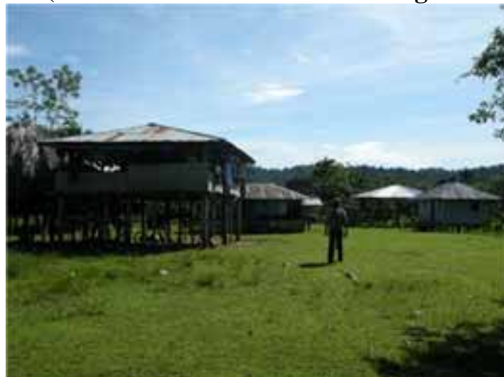
Fotografía 5 (Panorámica del resguardo Pescadito)

En lo concerniente al impacto que pudiese tener la construcción de la carretera en el resguardo Chidima-Tolo, la verificación en la zona fue plasmada en los siguientes términos: