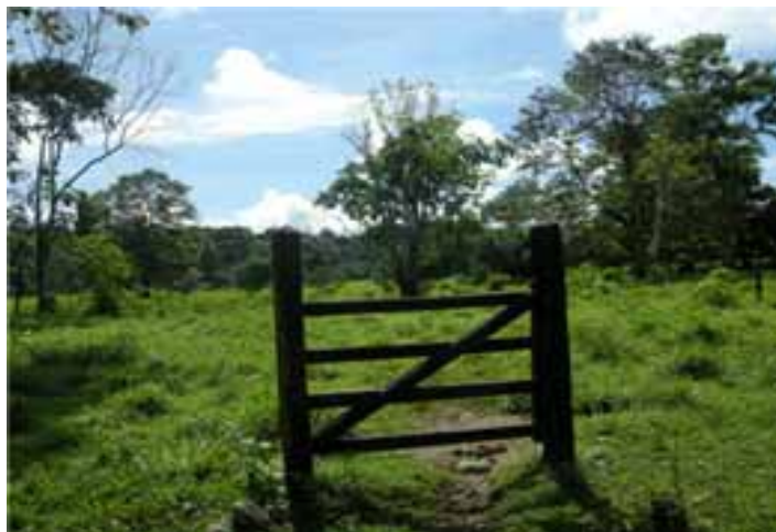
Fotografía 17 (Presencia de explotación ganadera en la zona aledaña a los resguardos).

En armonía con lo anterior, de la visita se pudo constatar el impacto que ha sufrido el medio ambiente en la zona a través de la tala de amplias zonas de bosque y el uso para ganadería de las tierras deforestadas, como se puede apreciar en las fotografías obtenidas por la inspección realizada por la Corte Constitucional en la zona. 102