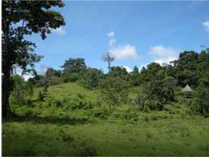
Fotografía 8 (Panorámica del resguardo Chidima).