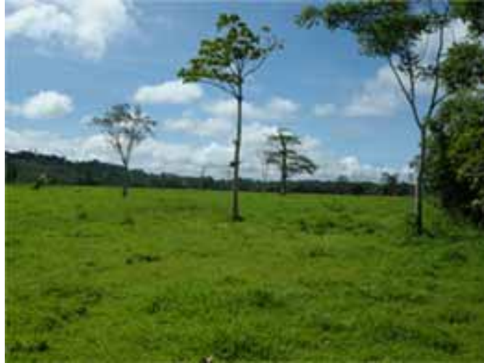
Fotografía 18 (Afectación del medio ambiente para pastoreo).