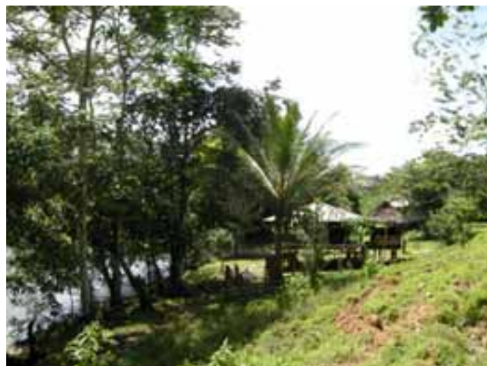
Fotografía 7 (Panorámica del resguardo Chidima).