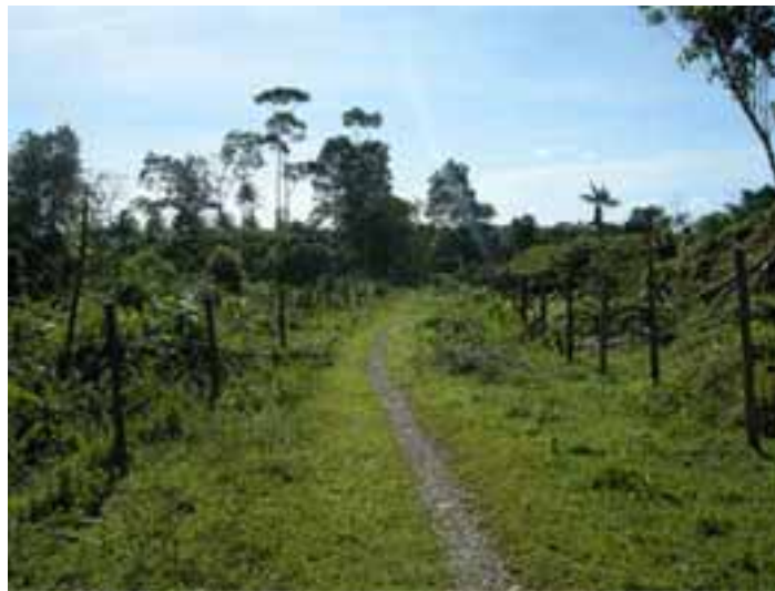
Fotografía 4 (Trazado de la vía dentro del resguardo Pescadito).