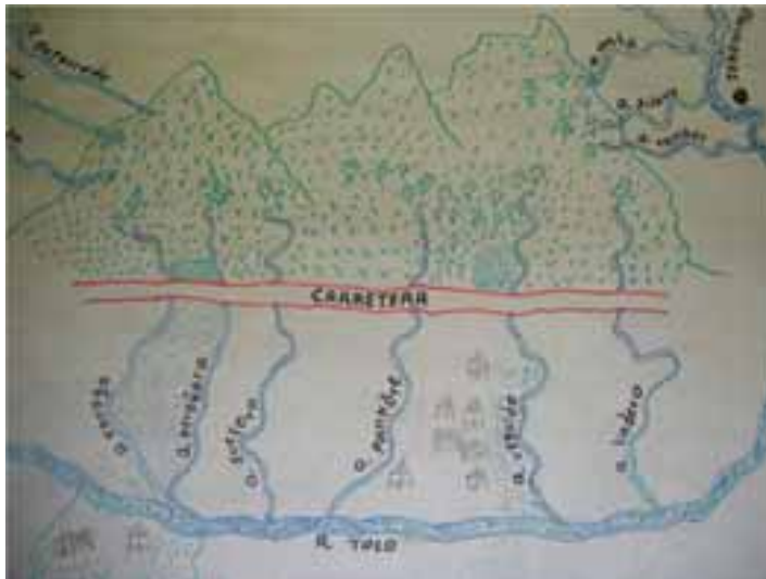
Fotografía 9 (Mapa elaborado por la comunidad respecto de su concepción de lo que es el trazado de la carretera).

Considerando lo anterior y lo informado por las entidades accionadas en lo de su competencia y de acuerdo con lo verificado por la Corte en la zona, se concluye que la consulta previa no ha sido agotada para la construcción de la carretera. Lo afirmado lo refuerza la propia inspección no consultada con las comunidades indígenas por parte de la Agencia Logística de las Fuerzas Armadas efectuada por vía aérea los días 20, 21 y 22 de mayo de 2009, la cual contó con la participación de representantes de la alcaldía de Acandí y Corpochocó y de la que se concluyó: “(i) la vía hay que construirla en los (4) kilómetros faltantes, por tal motivo requiere la licencia ambiental; además estos mismos 4 kilómetros se evidencia la necesidad de la construcción de un puente de sesenta (60) metros de luz sobre el río Tolo el cual no está contemplado en ningún capítulo del proyecto. 2) no se ha socializado y mucho menos se ha iniciado el proceso de consulta previa con las comunidades indígenas. 3) No existe información técnica en general del proyecto. Por tal razón se solicitó a la Dirección General de la Agencia logística no iniciar las obras hasta que se hayan aclarado y solucionado los puntos mencionados. ” 81