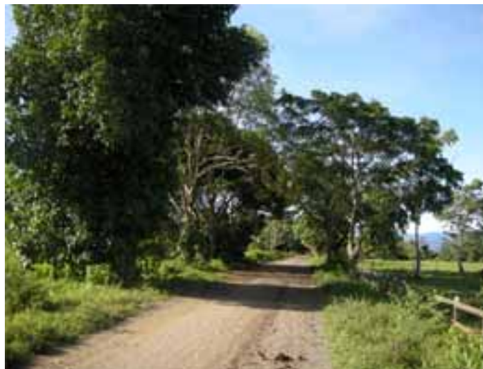
Fotografía 1 (Vía a los resguardos desde Acandí).

En la inspección judicial efectuada por la Corte se pudo verificar que en lo que respecta al resguardo Pescadito el trazado que trae la carretera conectaría directamente con la comunidad, ya que “el proyecto de la carretera intervendría directamente la zona del resguardo ya que pasaría muy cerca del lugar de donde más se concentra población de la comunidad Pescadito. Adicionalmente, el gobernador del resguardo procedió a señalar la montaña y el bosque sur-oriental el cual es considerado por los indígenas como sagrado, ya que es una de las zonas más conservadas del resguardo. Del mismo modo, se apreció que a tan sólo a 80 metros de donde culmina el camino de herradura, en línea recta éste desaparece ya que variedades de árboles y plantas dificultan la continuidad del camino al punto que lo hace desaparecer.” 79