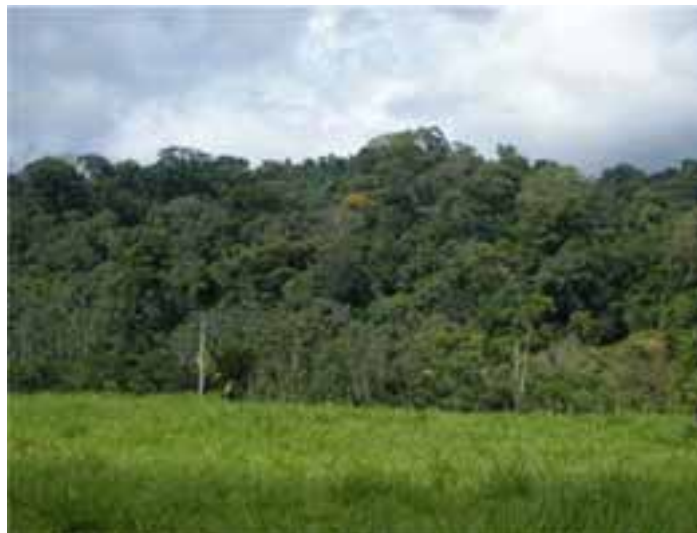
Fotografía 19 (Contraste de la tierra intervenida y la que se conserva).