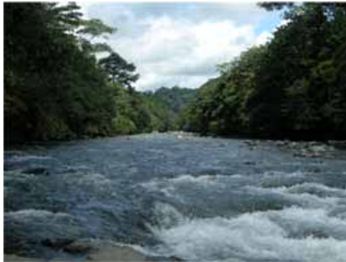
Fotografía 10 (Río Tolo).

Relacionado con lo anterior, de la inspección efectuada por la Corte en los resguardos Pescadito y Chidima de la comunidad Embera se pudo constatar que el río Tolo es parte fundamental de las dos comunidades ya que los principales asentamientos de viviendas y lugares colectivos se encuentran en cercanía de dicho afluente, del cual derivan el líquido vital. 94 En virtud de ello, toda intervención o afectación que pueda tener el río por el tipo de explotación que tiene la explotación de minerales de profundo impacto se hace indispensable desarrollar la consulta previa con las comunidades étnicas afectadas, y desde ya advertir que todo tipo de intervención que se pretenda a futuro en el río, ilustre desde el inicio de cualquier proyecto el alcance de la obra y la búsqueda del consentimiento, previo, libre e informado conforme a las subreglas de esta providencia.