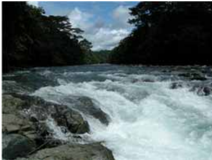
Fotografía 12 (Río Tolo).

9.6.3 De otra parte de la información allegada en sede de revisión se informa que se presenta explotación ilegal de oro dentro de los territorios, que aunque a finales del año pasado y comienzos de este solo queda una draga en la rivera del río Tolo, esta ha provocado la contaminación en el afluente, con la consecuencia de la disminución de especies, enfermedades en la piel, diarrea, vomito y otras afectaciones de la salud de la comunidad. 95 Si bien a la Sala no le consta lo anterior, es necesario que se investigue la presunta irregularidad por parte del organismo competente.