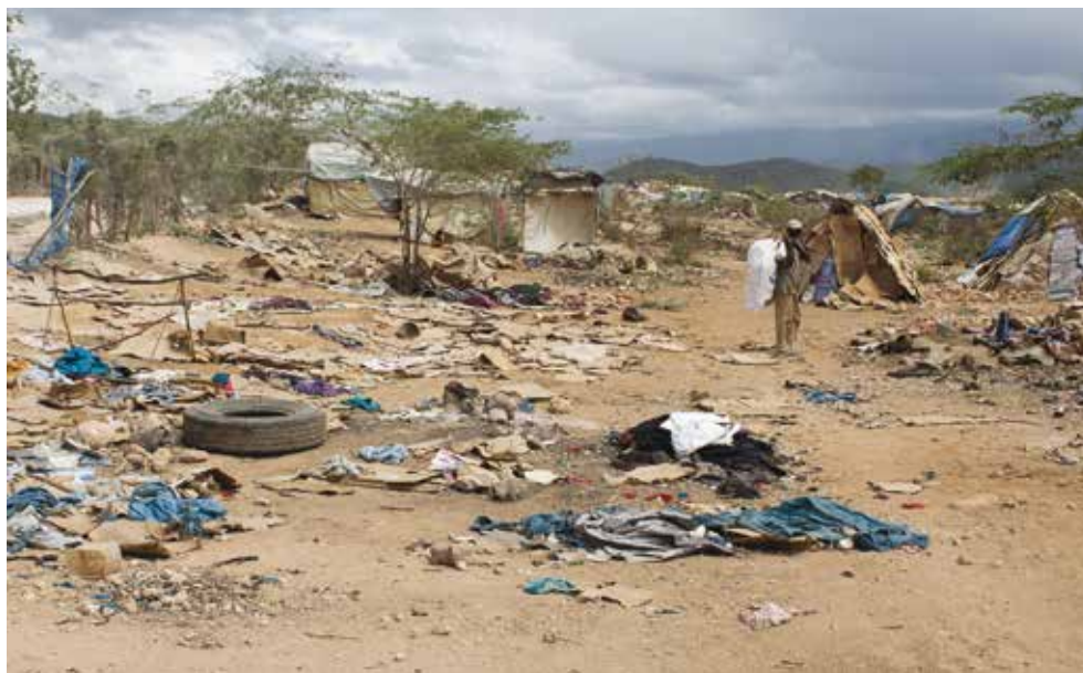
Des résidents détruisent leurs tentes avant d'être relocalisés. Parc Cadeau 2, avril 2016.

On peut certes comprendre ces considérations, mais Amnesty International juge essentiel de compléter le plan de relocalisation avec des interventions plus durables, aussi bien pour les familles relogées que pour les localités qui les accueillent 28 . Au moment de la rédaction de ce rapport, les autorités haïtiennes et des organisations nationales et internationales d'aide au développement et d'aide humanitaire réfléchissaient sur des mécanismes spécifiques pour améliorer l'approvisionnement en eau et l'accès aux services de santé et à l'éducation des familles relogées et des communautés qui les accueillent. Toutefois, ces initiatives risquaient d'être entravées par l'insuffisance des moyens de financement et le peu de motivation affichée par les prestataires de services locaux. Très rares étaient les organisations humanitaires qui avaient proposé des programmes visant à assurer des moyens de subsistance durable pour les familles relogées 29 .