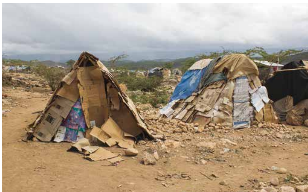
© Parc Cadeau 2, avril 2016. ©AmnestyInternational

Des organisations humanitaires et de défense des droits humains ont mis en évidence la présence dans les camps de diverses maladies : diarrhées, vomissements fréquents, infections de la peau, fièvre et problèmes respiratoires, notamment 17 . Comme Amnesty International l'a constaté, de nombreux enfants vont pieds nus et sans vêtements, ce qui les rend plus vulnérables aux maladies. Depuis l'apparition du choléra à Anse-à-Pitres, en octobre 2015 18 , 26 personnes au moins ont contracté la maladie et sept sont mortes 19 . La plupart vivaient dans un camp. Faute de structures adéquates dans les camps ou à proximité, et de moyens suffisants chez les personnes concernées, l'accès aux soins de santé est très limité.