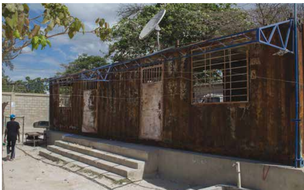
© Bureau des services haïtiens de l'immigration à Anses-à-Pitres, avril 2016. Le bâtiment, visé par un incendie volontaire début 2016, n'a pas été remis en état. Le représentant des services était assis dans la rue quand Amnesty International s'est rendue à Anse-à-Pitres. ©AmnestyInternational

Certains des témoignages ci-dessus révèlent également que les autorités dominicaines n'ont pas pleinement respecté le Protocole d'accord sur les mécanismes de rapatriement conclu entre les gouvernements dominicains et haïtiens en décembre 1999. Ce texte prévoyait plusieurs garanties, la République dominicaine s'engageant notamment à ne pas expulser de migrants la nuit ou via des postes-frontières informels ; à éviter de séparer les familles nucléaires ; à autoriser les personnes expulsées à récupérer leurs affaires et à conserver leurs papiers d'identité ; à remettre un exemplaire de son avis d'expulsion à chaque personne expulsée ; et à informer au préalable les autorités haïtiennes des opérations d'expulsion.