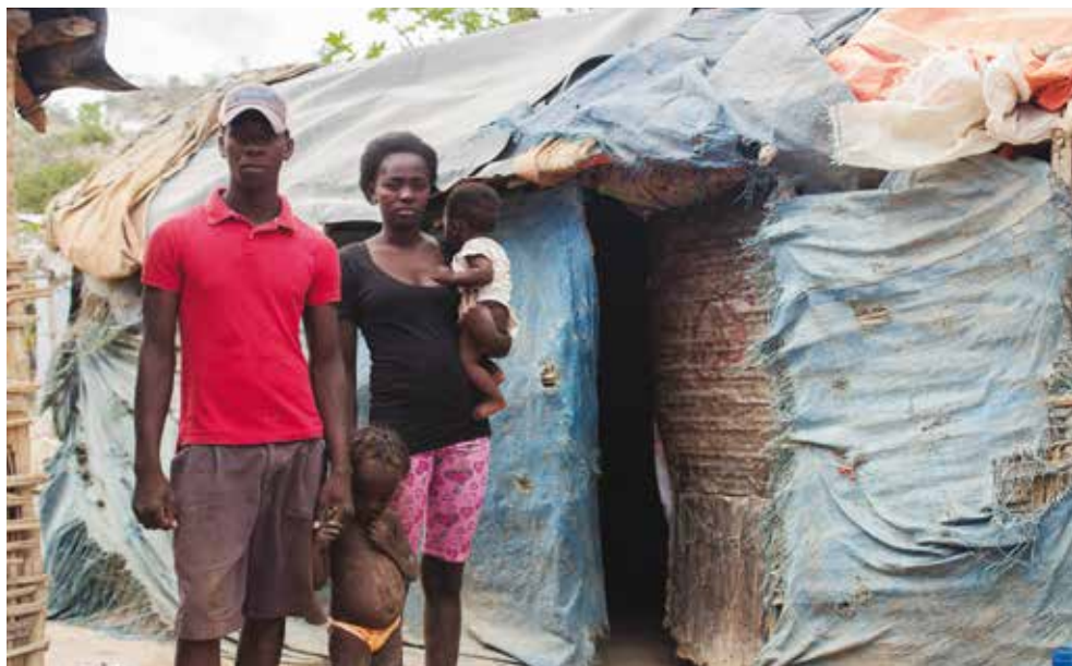
© Fefe Jean et sa famille, Parc Cadeau 1, avril 2016. ©AmnestyInternational

qui ne se sont pas inscrites dans le cadre du programme de naturalisation prévu par la loi 169-14 65 .