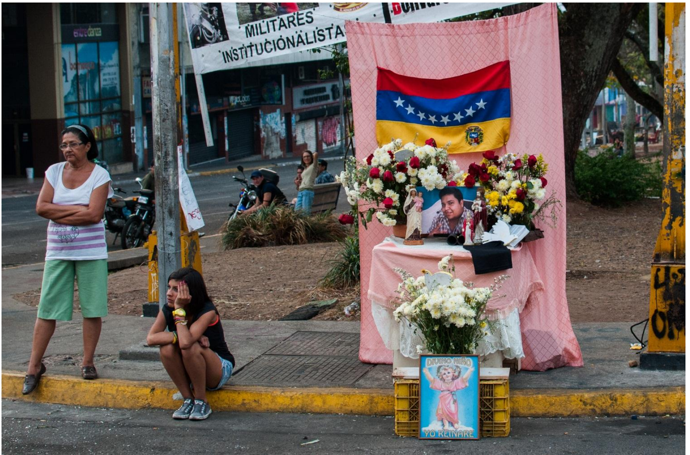
Arriba: Altar en memoria a Daniel Tinoco, estado Táchira, marzo 2014