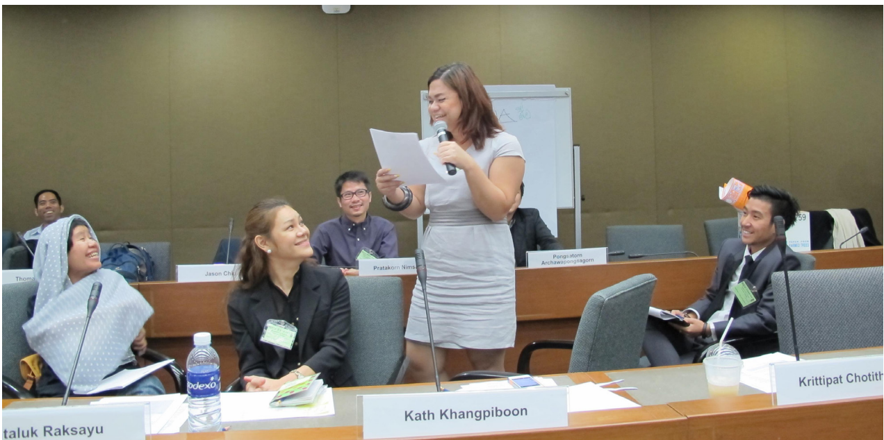
Findings and recommendations of the dialogue being presented by participants

ในส่วนต่อไปนี้จะกล่าวถึงภาพรวมของการปกป้องสิทธิของชาว LGBT ซึ่งจะแบ่งออกเป็น 6 ส่วนย่อยด้วยกัน ได้แก่ การจ้างงานและสิทธิว่าด้วยเรื่องที่อยู่อาศัย การศึกษาและเยาวชน สุขภาพและความเป็นอยู่ที่ดี ความสัมพันธ์ของคนในครอบครัวและทัศนคติทางสังคมและทางวัฒนธรรม สื่อและเทคโนโลยีสารสนเทศ และความสามารถขององค์กรที่ทำงานเพื่อชาว LGBT