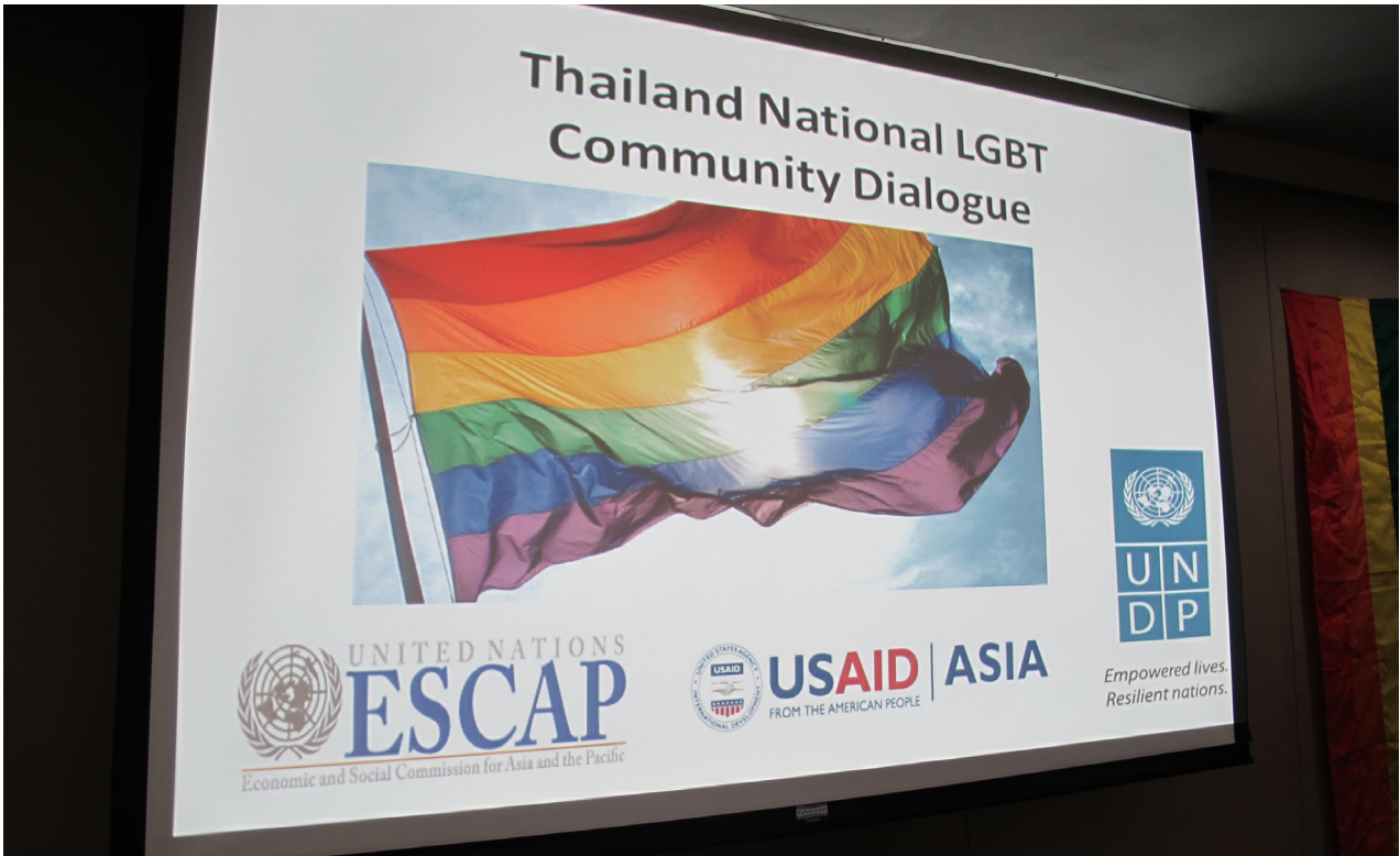
Screenshot of the sign for the Thailand national LGBT community dialogue