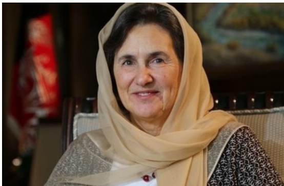
رولا غني، د افغانستان لومړۍ ميرمن

په پيل کې د افغانستان د خپرنې او ارزونې واحد ته د «جنسیت د نابرابرۍ بل اړخ» په افغانستان کې نارینه او نارینتوب» تر عنوان لاندې د هغوی د نوې خپرنې په مناسبت خپلې تودې مبارکۍ وړاندې کوم. د جنسیت د نابرابرۍ دغه اړخ، چې بیا بیا له پامه غورځول کېږي، یو بېړنی او خورا مهم عنوان دی، چې په افغانستان کې د ملي پالیسي او ټولنیزو بدلونونو لپاره ډیر زیات اهمیت لري.