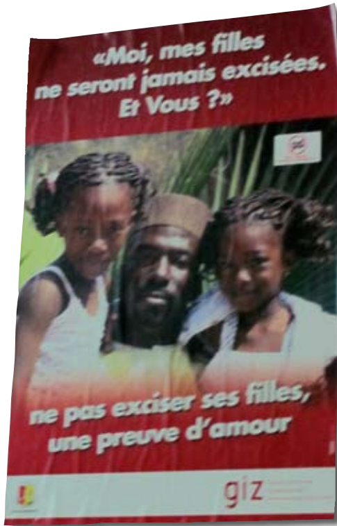
Campagne de prévention contre l'excision (CHU Ignace Deen) © CGRA, Conakry, novembre 2011.

praticiens de santé interrogés sur le sujet ont affirmé avoir constaté une diminution de leur prévalence ces dernières années 99 .