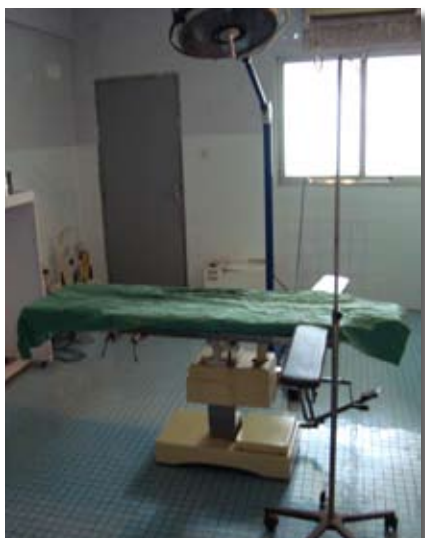
Bloc opératoire d'une polyclinique de Conakry © ODM, Conakry, novembre 2011.

L'Etat guinéen conduit actuellement divers programmes de santé auxquels les personnes concernées ont accès gratuitement. Les objectifs en sont la lutte contre la tuberculose, le traitement contre le VIH/SIDA ou encore l'accouchement dans les structures de soins étatiques. Cependant, la mauvaise gestion, l'absence de formation de qualité et la corruption en empêchent la réalisation 154 . Il arrive par exemple fréquemment que le personnel soignant extorque malgré tout de l'argent lors d'accouchements 155 .