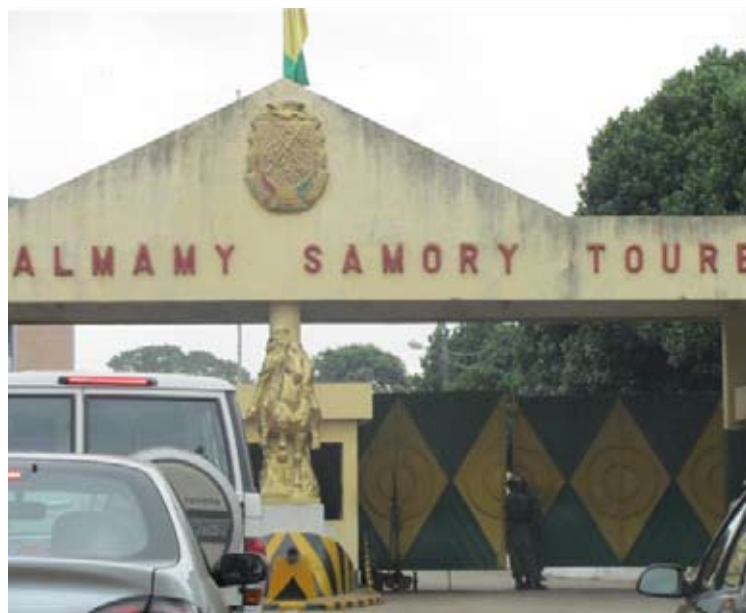
Entrée principale du camp A. S. Touré, Conakry, novembre 2011.

Le projet de réforme du secteur de la sécurité (RSS) initié dès la prise de pouvoir du général Konaté, avec un soutien international 49 , a été poursuivi par le président Alpha Condé. Un certain nombre de mesures ont été prises avec pour objectifs principaux de réduire les effectifs militaires, de garantir la transparence financière, de soumettre les services de sécurité au contrôle civil et de recentrer les attributions des FAG sur leur mission première de défense de l'intégrité territoriale.