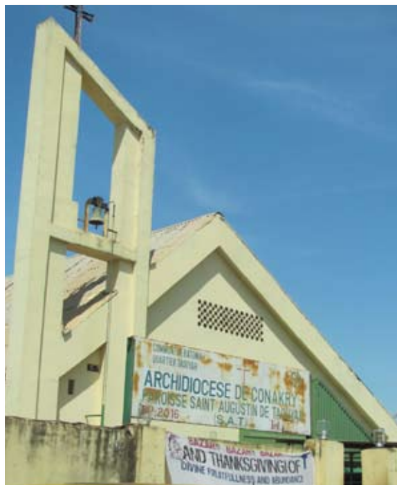
Paroisse Saint Augustin de Taouyah © CGRA, Conakry, novembre 2011.

Il existe une grande entente et de très bonnes relations entre les religions. Il n'est pas rare que des membres d'une même famille soient de confession différente 78 . Bon nombre de personnes de confession musulmane inscrivent leurs enfants dans les écoles catholiques car elles jouissent d'une très bonne réputation 79 . Les représentants des différentes communautés religieuses se retrouvent à l'occasion de cérémonies comme la célébration de mariages ou encore lors d'enterrements 80 .