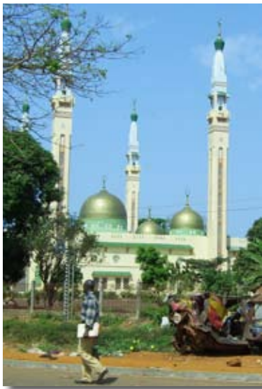
Grande mosquée Fayçal © CGRA, Conakry, novembre 2011.

La Guinée est un état laïc composé de 85% de musulmans, 10% de chrétiens et 5% d'animistes. La liberté religieuse est inscrite dans la constitution 70 .