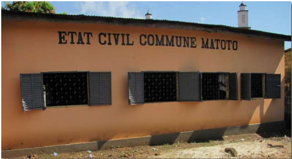
Bureau de l'état civil de la commune de Matoto © CGRA, Conakry, novembre 2011.

officier d'état civil a indiqué aux membres de la mission que ces pratiques avaient eu lieu récemment. Plusieurs agents ont été poursuivis de ce fait mais il est très difficile, pour des raisons matérielles, de contrôler la régularité de la délivrance de tous les documents 140 .