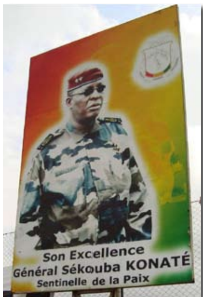
Affiche en l'honneur du président de la République par interim (déc. 2009- déc. 2010) © OFPRA, Conakry, novembre 2011.