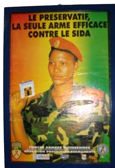
Campagne de prévention contre la transmission du VIH © ODM, Conakry, novembre 2011.

A côté des pharmacies et des cliniques privées, le système de santé public a une structure pyramidale. A Conakry, se trouvent les centres hospitaliers universitaires (CHU) Donka et Ignace Deen qui sont les cliniques nationales de référence. Construite par la Chine à Kipé (Conakry), la troisième clinique de référence attend depuis plusieurs mois sa mise en service. Dans l'arrière pays, chacune des sept régions dispose de sa propre clinique de référence (hôpitaux régionaux). En outre, il existe un établissement dans chacune des 26 préfectures. Enfin, des centres médico-communaux, des centres de santé ainsi que des postes de santé sont répartis sur l'ensemble du territoire 153 .