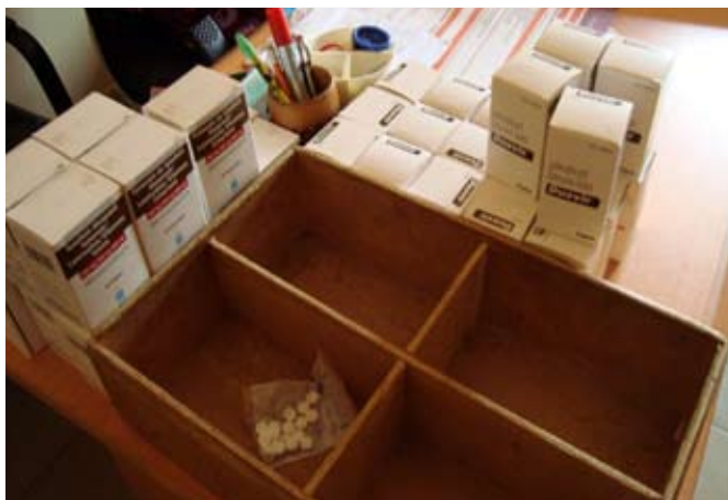
Traitements contre le VIH © ODM, Conakry, novembre 2011.

Cette situation est d'autant plus regrettable que la délégation a pu se convaincre, lors de son passage au CHU Donka 160 ainsi que lors d'un entretien avec un patient atteint du VIH 161 , de la bonne organisation et de la qualité du programme gouvernemental de lutte contre le VIH/SIDA. Au total, quelque 200 à 250 patients en bénéficient et peuvent être soignés dans ce cadre chaque mois. Sans celui-ci, les personnes concernées, qui continuent d'être stigmatisées, ne pourraient guère se procurer les médicaments onéreux 162 . A cela s'ajoute le fait qu'environ 2 % seulement de la population guinéenne a contracté une assurance-maladie 163 .