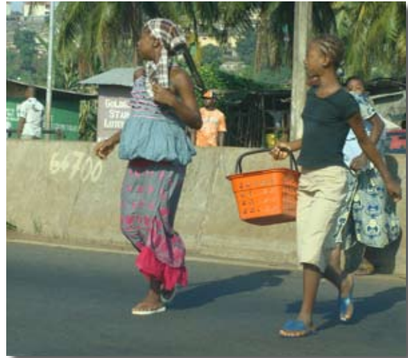
Jeunes femmes à Conakry © OFPRA, Conakry, novembre 2011.

Selon la loi guinéenne 82 , seul le mariage civil célébré devant l'officier d'état civil est reconnu. Il doit obligatoirement précéder le mariage religieux. Dans les faits, il en est tout autrement. Généralement, le mariage religieux, qui est aux yeux des Guinéens le plus important, précède le mariage civil, ce dernier n'étant parfois même pas célébré. Lorsqu'il intervient, le mariage civil est souvent motivé par des considérations d'ordre administratif 83 .