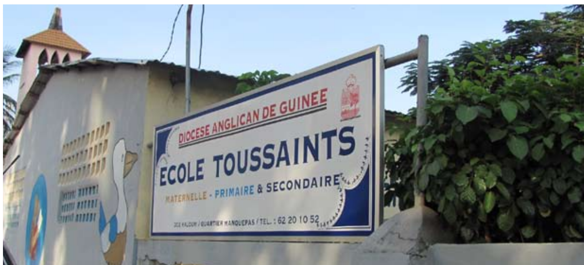
Ecole anglicane à Conakry © CGRA, Conakry, novembre 2011.

Les membres de la mission ont pu constater que la pratique de la religion se fait dans un esprit de tolérance et de respect mutuel. Les chrétiens n'ont pas à se cacher. Ainsi, leurs lieux de culte sont visibles, de même que les écoles et dispensaires qui y sont souvent rattachés. Ils ne craignent pas d'exprimer par des signes extérieurs leur appartenance religieuse. Bon nombre de couples affichent leur mixité religieuse. La tenue vestimentaire des femmes est loin d'être rigoriste. Une présence très marginale de femmes portant le voile noir intégral a pu être constatée, essentiellement dans la commune de Ratoma. La vente et la consommation d'alcool ne sont par ailleurs pas interdites.