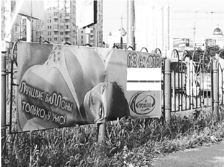
Рис. 3. Оголошення компанії ПрофіГаз.

Комітет одержав і розглянув лише 24 скарги на рекламні оголошення. 157 З них 24 були визнані дискримінаційними, і 9 були згодом змінені.