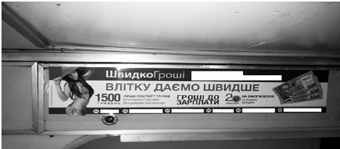
Рис. 2. Реклама фінансової компанії ШвидкоГроші у вагоні киявського метро, серпень 2012 року.

У 2011 році Українська Асоціація Маркетингу розробила Стандарти недискримінаційної реклами за ознакою статі. 156 Для забезпечення відповідності стандартам був створений Індустріальний гендерний комітет з реклами, призначений для розгляду (за власною ініціативою або за скаргою) сексистської реклами. Статистика, однак, переконує, що цей комітет є, здебільшого, неефективним у боротьбі із сексистською рекламою. Веб-сайт Комітету повідомляє, що станом на липень 2014 року