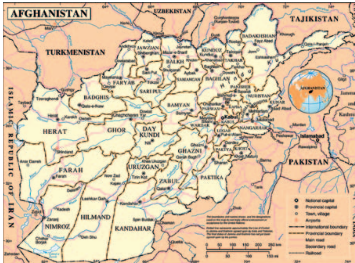
Abbildung 1: Landkarte Afghanistans (8)

Der Berichtsentwurf wurde nationalen COI-Sachverständigen für Afghanistan aus Belgien, Dänemark, den Niederlanden, Norwegen und Österreich mit der Bitte um Prüfung und Stellungnahme übermittelt. Der kommentierte Berichtsentwurf wurde anschließend einer Referenzgruppe aus Sachverständigen aus den Mitgliedstaaten sowie aus assoziierten oder noch nicht assoziierten Ländern, der Europäischen Kommission und dem UNHCR vorgelegt. Alle Mitglieder der Referenzgruppe wurden um Stellungnahme gebeten. Alle eingegangenen Anmerkungen wurden geprüft und größtenteils berücksichtigt.