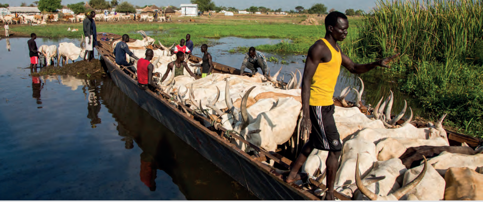
المفوضية السامية للأمم المتحدة لشؤون اللاجئين/ أندرو مكنونيل/ جنوب السودان. قطع من الماشية تم تحميله إلى قارب ليتم نقله عبر نهر النيل