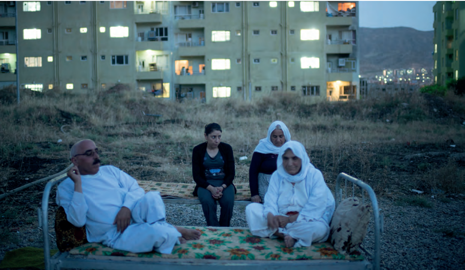
© المفوضية السامية للأمم المتحدة لشؤون اللاجئين / إ.د. أو العراق. أسرة نازحة داخلياً تجلس خارج بناية غير مكتملة البناء حيث يعيشون.

لتحفيز اهتمام الجهات المانحة وثقتها بانخراط المفوضية السامية للأمم المتحدة لشؤون اللاجئين في أوضاع النزوح الداخلي، من الضروري ضمان وجود جزء سردي، ومنتجات تصف وجود التزام بتوفير الحماية وإيجاد الحلول عبر النطاق الكامل للنزوح القسري. ويتعيّن على المكاتب الميدانية والقُطرية رصد أمثلة ملموسة عن الطريقة التي تُحدث فيها مبادرات التدخل من جانب المفوضية، ومن ضمنها المساعدات النقدية، حيثما يكون ذلك مناسباً، أثراً مباشراً على حياة الأشخاص النازحين داخلياً والمجتمعات المحلية المُضيقة لهم؛ كما تحتاج إلى الإبلاغ عنها بصورة روتينية. كذلك يتعيّن إعداد تفصيل دقيق ومختصر للاحتياجات ضمن إطار استعراض الاحتياجات الإنسانية. كذلك فإنّ الاتصالات والبروز الواضح للأثر على الأشخاص المتضررين تؤدّي دوراً رئيسياً في إثارة اهتمام الجهات المانحة.