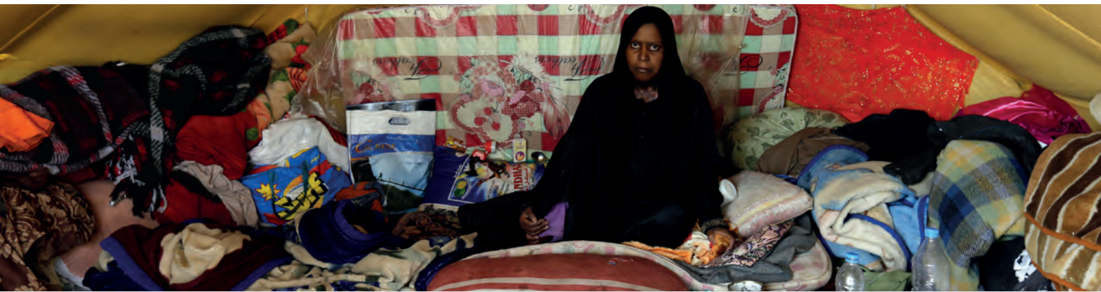
© المفوضية السامية للأمم المتحدة لشؤون اللاجئين / يحيى أرحاب، اليمن. امرأة نازحة داخليا تجلس داخل خيمتها في شمالي محافظة عمران.

3- يُطَّلِع منسق عمليات الإغاثة في الحالات الطارئة المنسق المقيم/منسق الشؤون الإنسانية على القرار الذي يتخذه رؤساء الوكالات الأعضاء في اللجنة الدائمة المشتركة بين الوكالات بشأن ترتيبات المجموعات العنقودية على المستوى القطري. وبعد ذلك يتم تبادل هذه المعلومات مع الفريق القطري للأمم المتحدة/الفريق القطري للعمل الإنساني، والوكالات القيادية والشركاء ذوي الصلة. ويجب على ممثلي المفوضية، في الأوضاع التي تضطلع فيها المفوضية بدورها القيادي