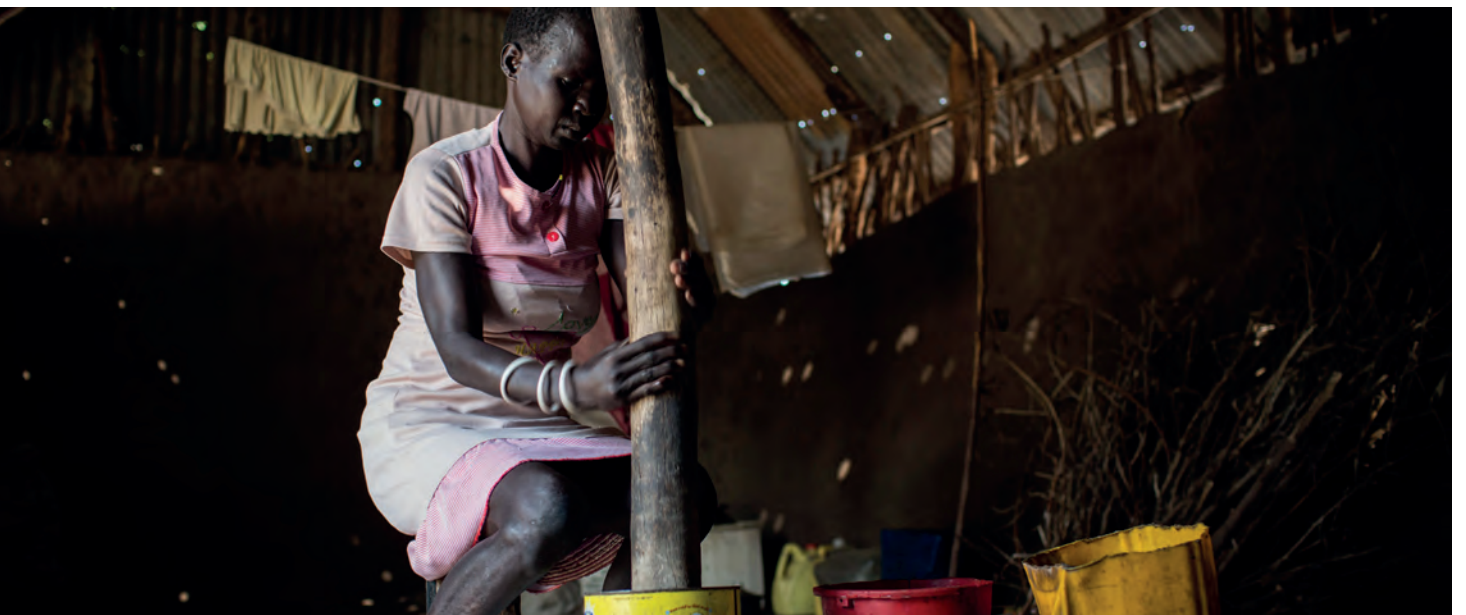
© المفوضية السامية للأمم المتحدة لشؤون اللاجئين / أندرو مكونل. جنوب السودان. امرأة نازحة داخلياً تدقّ الذرة البيضاء وتجلس في غرفة صفية مهجورة في لير.