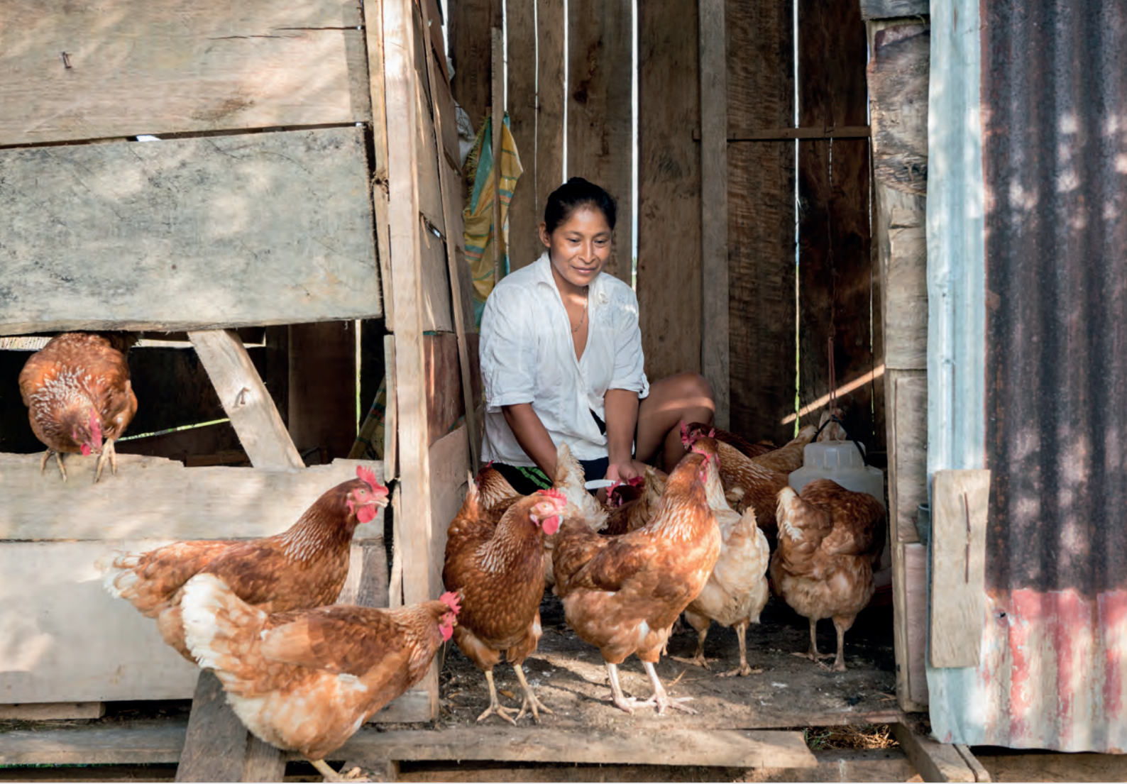
© المفوضية السامية للأمم المتحدة لشؤون اللاجئين / روبن سالغادو / كولومبيا، امرأة نازحة داخلياً تطعم دجاجها في حظيرة صغيرة خارج منزلها. ويُساعد البيض الذي يفقس يومياً في إطعام أسرته وتوفير دخل ضئيل عن طريق بيعه.