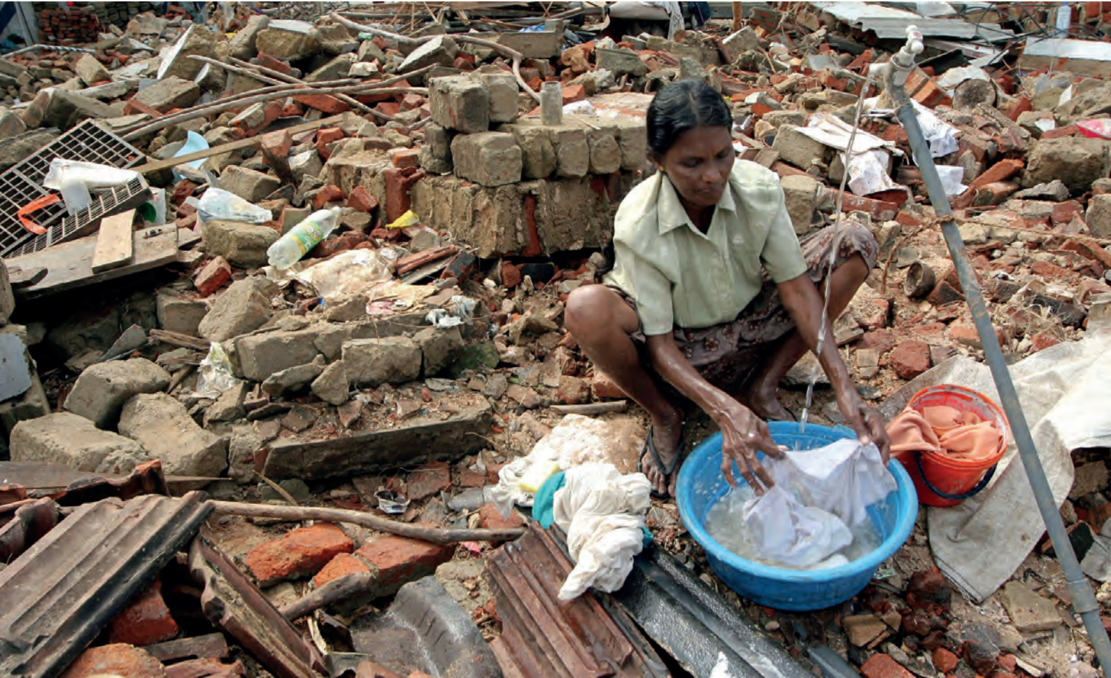
سيرلانكا. ناجية من إعصار تسونامي/ أثناء قيامها بغسل الثياب فوق أنقاض منزلها الذي دمره الإعصار في جالي.

وقد تُوجد فرصٌ لتعبئة الموارد بين الجهات المانحة الحكومية مع وجود اهتمام تم التعبير عنه بالأشخاص النازحين داخلياً. إن التأكد من إحاطة تلك الجهات المانحة بصورة جيدة عن أدوار وضع البرامج والتنسيق التي تُؤدّيها المفوضية السامية