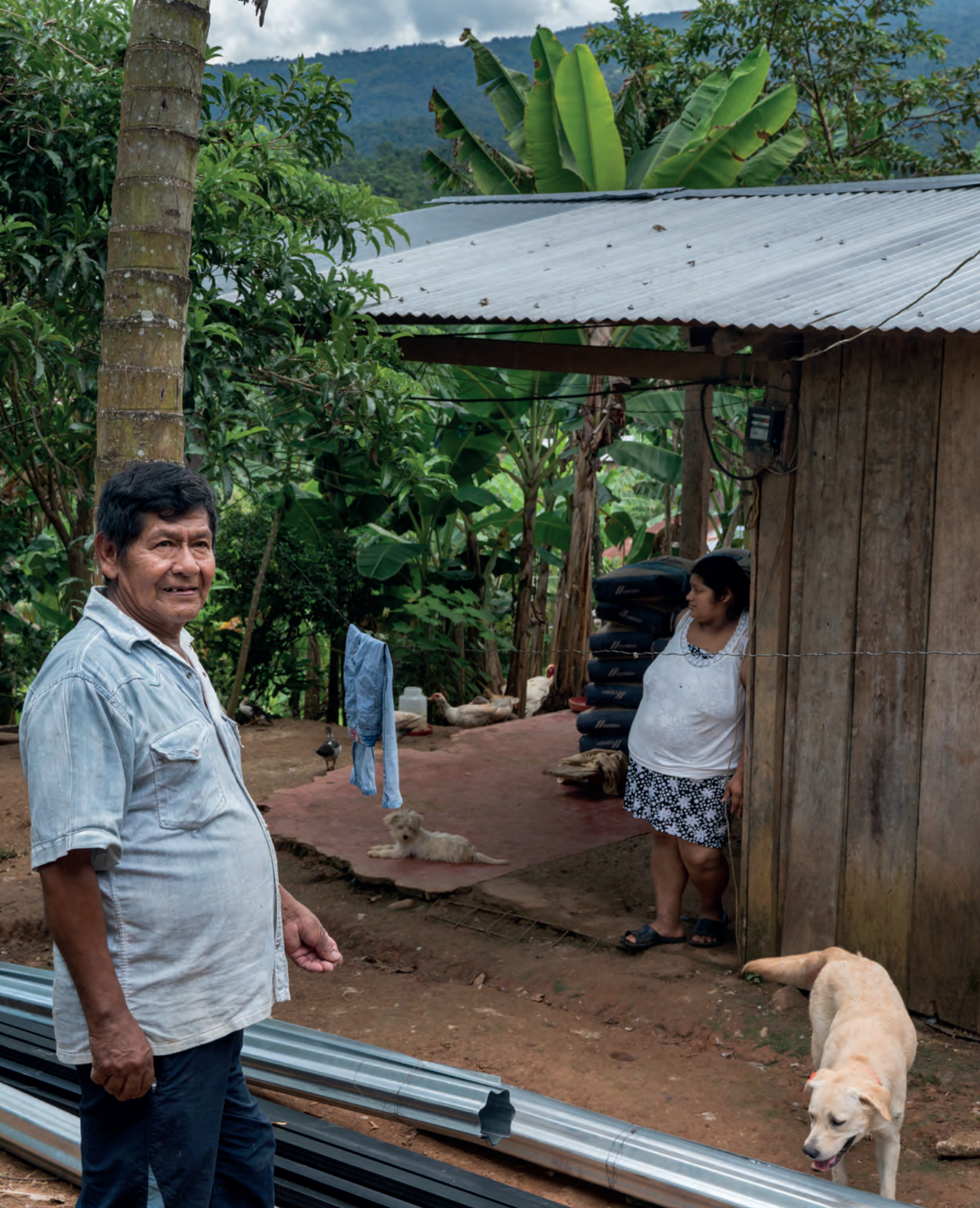
كولومبيا: رجل نازح داخليا يقف بجوار بيته بصحبة زوجته في نيوفا/إسيرانزا. فرّ من بيته في مونتانيئا كاكيتا، ويعيش هنا منذ عام 2003.