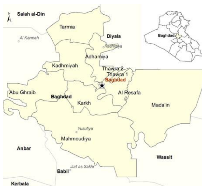
Province de Bagdad 2

Ce COI Focus a pour ambition de présenter un tableau général de la violence dans la province de Bagdad, qui comprend la capitale irakienne et ses alentours, notamment Mahmudiya, Tarmia, Mada'in et Abu Ghraib 1 .