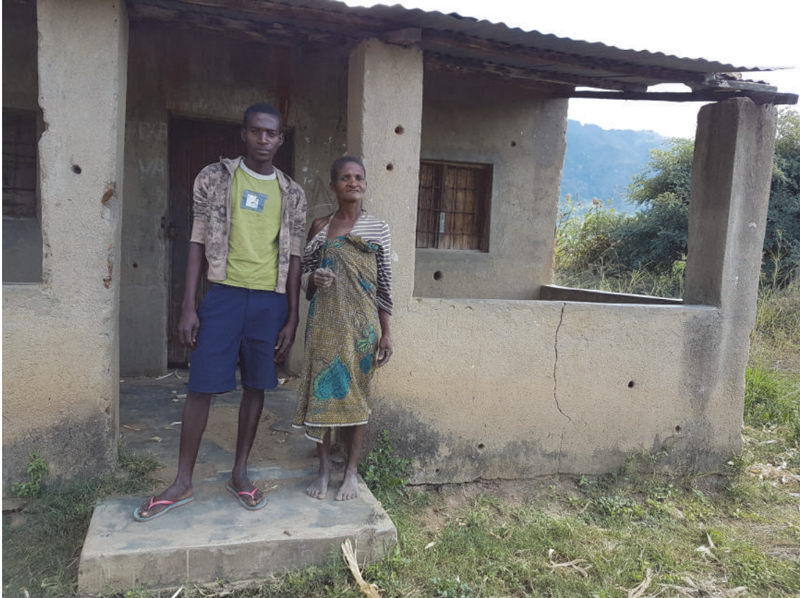
Uma mulher e o seu filho à frente da sua casa com buracos de balas, na aldeia de Mukodza, Gorongosa. Disseram que os soldados chegaram em veículos do exército e que dispararam sem aviso prévio contra a casa em junho de 2016, forçando-os a fugir por uma janela.

Os moradores da aldeia de Mukodza disseram que os soldados dispararam as armas contra as suas casas. Uma mulher de 54 anos explicou o que viu: