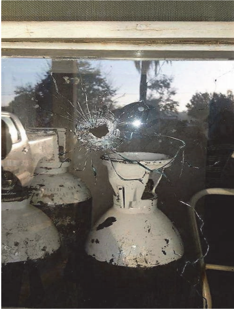
Buraco de bala na janela do Hospital Distrital de Morrumbala após a invasão dos homens da Renamo em 12 de agosto de 2016.