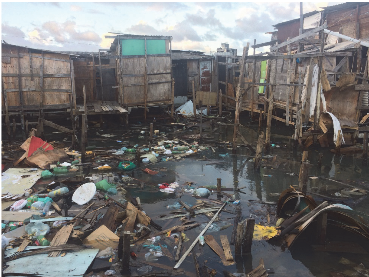
Esgoto e lixo são despejados diretamente no rio em uma favela no bairro dos Coelhos, Recife, estado de Pernambuco.

empresa estatal de água, hoje cerca de 35 por cento da população da região metropolitana de Recife têm acesso ao sistema de esgotamento sanitário. 141