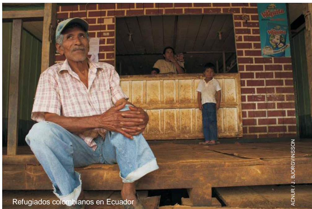
Refugiados colombianos en Ecuador