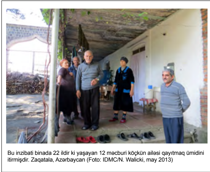
Bu inzibati binada 22 ildir ki yaşayan 12 məcburi köçkün ailəsi qayıtmaq ümidini itirmişdir. Zaqatala, Azərbaycan

Dağlıq Qarabağ üzərində Ermənistan ilə münaqişə nəticəsində 90-cı illərdə evlərini tərk etmiş 597000 məcburi köçkün üçün qayğı və müdafiənin əsas təminatçısı Azərbaycan hökuməti qalmaqdadır. Hökumət son 20 il ərzində məcburi köçkünlərin problemlərinə əhəmiyyətli vəsait sərf etmişdir. Həmçinin, məcburi köçkünlük barədə məlumatlılıq artırılmış, məlumat yığılmışdır, məcburi köçkünlərin hüquqları barədə məmurlar təlimləndirilmiş, köçkünləri müdafiə edən yeni qanunlar, siyasət və proqramlar qəbul edilmişdir. Bəzi köçkünlərin hüquqları hətta onların yerli qonşularından daha üstün şəkildə təmin olunur.