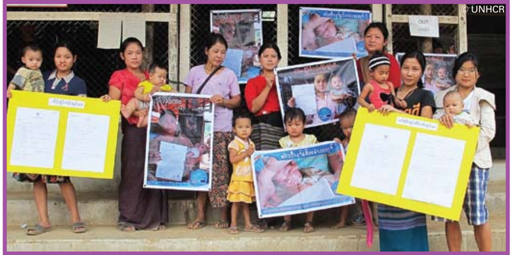
ผู้ลี้ภัยและลูกๆ เข้าร่วมฟังการอบรมการลงทะเบียนการเกิด

ยูเอ็นเอชซีอาร์ยังคงมุ่งมั่นทำงานเป็นหน่วยงานหลักในการให้ความคุ้มครองผู้ลี้ภัย โดยจัดตั้งคณะทำงานประสานงานด้านการให้ความคุ้มครองที่ อ.แม่สอด จ.ตาก และให้คำแนะนำแก่คณะทำงานในระดับจังหวัด ยูเอ็นเอชซีอาร์มุ่งเน้นที่การเผยแพร่หลักการด้านมนุษยธรรมและมาตรฐานการคุ้มครองระหว่างประเทศด้วยการจัดฝึกอบรมสำหรับผู้ที่มีส่วนร่วม และพันธมิตร นอกเหนือจากนั้นการประสานงานและแผนการให้ความช่วยเหลืออย่างเร่งด่วนต่อผู้อพยพที่เข้ามาใหม่ของยูเอ็นเอชซีอาร์ได้ช่วยเสริมสร้างความพร้อม และบทบาทในการให้ความคุ้มครองบริเวณชายแดน