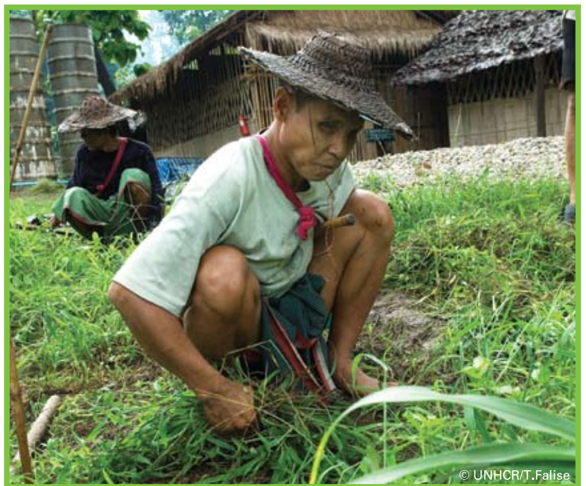
ผู้ลี้ภัยที่ตามอดกำลังทำการเกษตรในค่ายผู้ลี้ภัย

การถูกจำกัดในค่ายผู้ลี้ภัยมานานกว่า 2 ทศวรรษ รวมถึงข้อจำกัดที่ไม่ได้รับอนุญาตให้ออกนอกค่าย และทำงานเลี้ยงชีพ ทำให้ยูเอ็นเอชซีอาร์พยายามที่จะส่งเสริมผู้ลี้ภัยจากประเทศพม่าให้เกิดการพึ่งพาตนเอง โดยการเพิ่มการฝึกอบรมอาชีพ และการพัฒนาความสามารถในการดำรงชีวิต เนื่องจากการขาดงบประมาณ ข้อจำกัดทางนโยบาย และข้อจำกัดอื่นๆ ทำให้ในปี 2554 ยูเอ็นเอชซีอาร์ไม่สามารถสนับสนุนโครงการฝึกอาชีพทั้งหมดที่วางแผนไว้ได้ อย่างไรก็ตามผู้ลี้ภัยกว่า 235 คนใน 3 ค่ายได้มีโอกาสเข้าร่วมโครงการเกษตรกรรม ผู้หญิงที่เป็นหัวหน้าครอบครัว คนพิการ และผู้สูงอายุเป็นกลุ่มคนที่ยูเอ็นเอชซีอาร์ให้ความดูแลเป็นพิเศษ โดยสถาบันการศึกษาของไทยได้เป็นผู้ให้การสอน และให้ความรู้ทางด้านเทคนิค