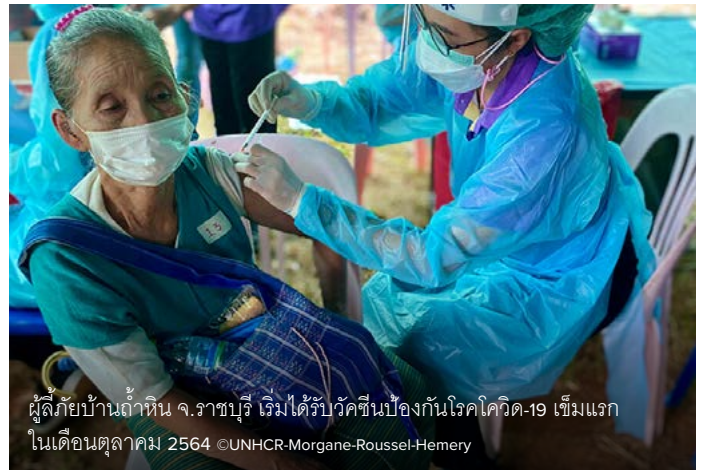
ผู้ลี้ภัยบ้านถ้ำหิน จ.ราชบุรี เริ่มได้รับวัคซีนป้องกันโรคโควิด-19 เข็มแรกในเดือนตุลาคม 2564

UNHCR ชาบซึ่งในน้ำใจจากประเทศไทยที่ได้ช่วยเหลือบุคคลที่มีความเปราะบางมากที่สุดให้สามารถเข้าถึงวัคซีนได้ และเรายังคงมุ่งมั่นสื่อสารกับชุมชนผู้ลี้ภัยเพื่อสร้างการตระหนักรู้ให้ได้ครอบคลุมมากที่สุด การมอบวัคซีนที่ครอบคลุมถึงผู้ลี้ภัยเป็นการยืนยันที่ชัดเจนถึงความมุ่งมั่นของประเทศไทยในการยึดหลักการรวมเป็นอันหนึ่งอันเดียวกันโดยไม่ทิ้งใครไว้ข้างหลัง