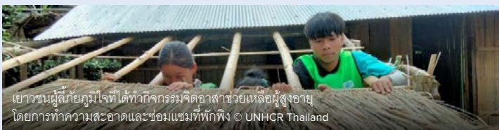
เยาวชนผู้ลี้ภัยภูมิใจที่ได้ทำกิจกรรมจิตอาสาช่วยเหลือผู้สูงอายุ โดยการทำความสะอาดและซ่อมแซมที่พักพิง