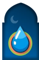
น้ำสะอาด