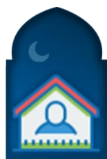
ที่พักพิง