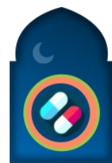
ยารักษาโรค