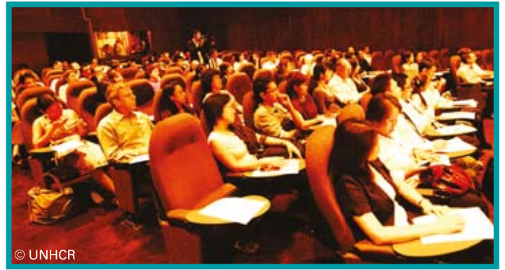
ผู้ร่วมงานประมาณ 150 คนร่วมชมภาพยนตร์เพื่อระลึกถึงผู้ลี้ภัยในวันผู้ลี้ภัยโลก

“ไม่รู้เรื่องผู้ลี้ภัยมาก่อนที่จะมาดูหนัง ตอนนั้นรู้แล้วว่าต้องช่วยพวกเขามากขึ้น จะช่วยยูเอ็นเอชซีอาร์ประชาสัมพันธ์ และหาผู้บริจาคมากขึ้น” ความคิดเห็นของหนึ่งในผู้ชม