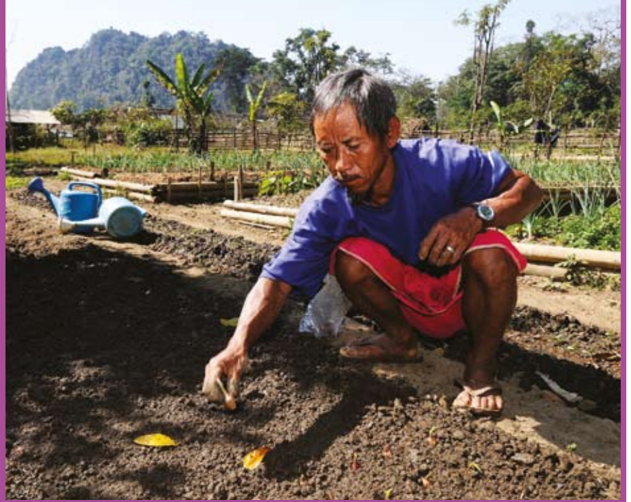
ผู้ลี้ภัยเข้าร่วมฝึกอบรมพัฒนาทักษะด้านการเกษตรที่สนับสนุนโดยยูเอ็นเอชซีอาร์