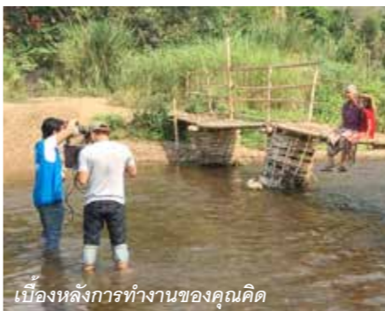
เบื้องหลังการทำงานของคุณคิด