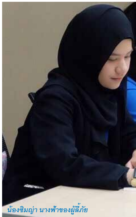
น้องชิมญา นางฟ้าของผู้ลี้ภัย