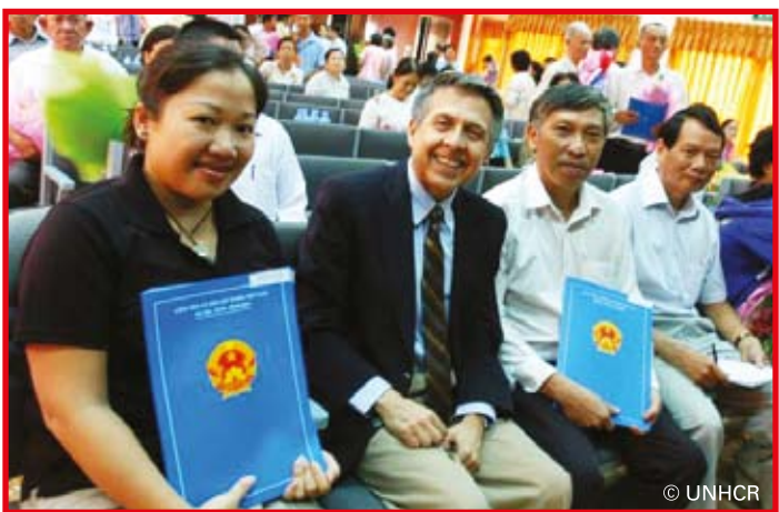
อดีตผู้ลี้ภัยชาวกัมพูชาบางส่วนถือใบรับรองสิทธิพลเมืองในงานที่เมืองโฮจิมินห์ซิตี้

ยูเอ็นเอชซีอาร์ ชื่นชมประเทศเวียดนามที่ได้มอบสิทธิพลเมืองแก่ผู้ลี้ภัยชาวกัมพูชาจำนวน 2,357 คน ซึ่งอพยพจากยุคเขมรแดงเมื่อกว่า 30 ปีที่แล้ว ในเดือน ก.ค. รัฐบาลเวียดนามได้มอบสิทธิพลเมืองแก่ผู้ลี้ภัยจำนวน 287 คน ส่วนอีก 2,070 คน น่าจะได้รับบัตรประชาชนในปลายปี 2553 ผู้ลี้ภัยชาวเขมรกว่า 1.7 ล้านคน เสียชีวิตจากการถูกทรมาน การประหาร โรคระบาด และการอดอาหารในยุคเขมรแดงตั้งแต่ปี พ.ศ. 2518 ถึง 2522