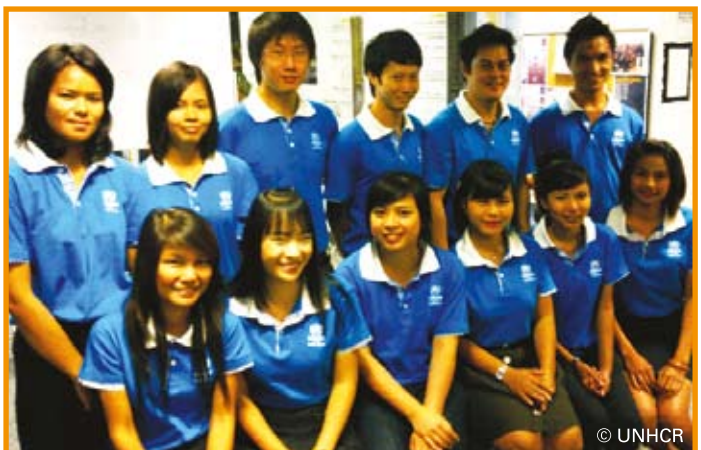
เจ้าหน้าที่ระดมทุนที่เป็นตัวแทนของยูเอ็นเอชซีอาร์ทำงานด้วยความมุ่งมั่นเพื่อเพิ่มยอดบริจาคในการช่วยเหลือผู้ลี้ภัยในไทย