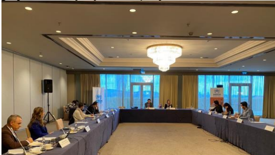
UNHCR, özel sektör temsilcileri ve İstanbul Büyükşehir Belediyesi Hayat Boyu Öğrenme Şube Müdürlüğü ile yuvarlak masa toplantısında bir araya gelerek uluslararası koruma ihtiyacı içindeki kişilerin işgücü piyasasına erişiminin önündeki engelleri ve potansiyel işbirliği alanlarını ele aldı.

UNHCR Temsilcisi, uluslararası koruma ihtiyacı içindeki kişilerin işgücü piyasasına erişimi, bu konudaki sorunlar, ihtiyaçlar ve potansiyel işbirliği alanlarını görüşmek üzere 19 Ekim'de özel sektör temsilcileriyle bir yuvarlak masa toplantısına katılmıştır. H&M, Inditex, Albaraka Türk, Ünlü Tekstil, Türk Amerikan İş Adamları Derneği (TABA), İstanbul Büyükşehir Belediyesi Sanat ve Meslek Eğitimi Kursları (İSMEK) ve bölge istihdam ofislerinden temsilciler toplantıda yer almıştır. UNHCR, tedarik zincirinde uluslararası koruma ihtiyacı içindeki kişileri istihdam eden ve işyerinde sosyal uyumluluğu hedefleyen bu şirket ve kuruluşlarla mesleki eğitim projeleri, bilgilendirme toplantıları ve çalışma izni desteği gibi birçok alanda ortak çalışmalarını sürdürmektedir.