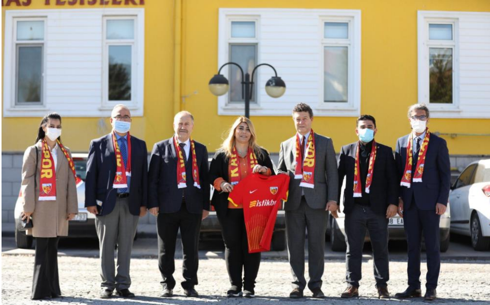
UNHCR heyeti Kayserispor'a ziyarette bulunarak tesisleri gezdi.

Dünya Bankası Türkiye ve UNHCR, Sosyal Girişim ve Kooperatifler Platformu kapsamında 2021'in dördüncü ve son yuvarlak masa toplantısını düzenlemiş, toplantıya bakanlıklar, ticaret odaları ve belediyelerden 46 temsilci katılmıştır. Sosyal girişimlerin güçlendirilmesinde ulusal kurumların rolü ve potansiyel işbirliği alanları ele alınmıştır.