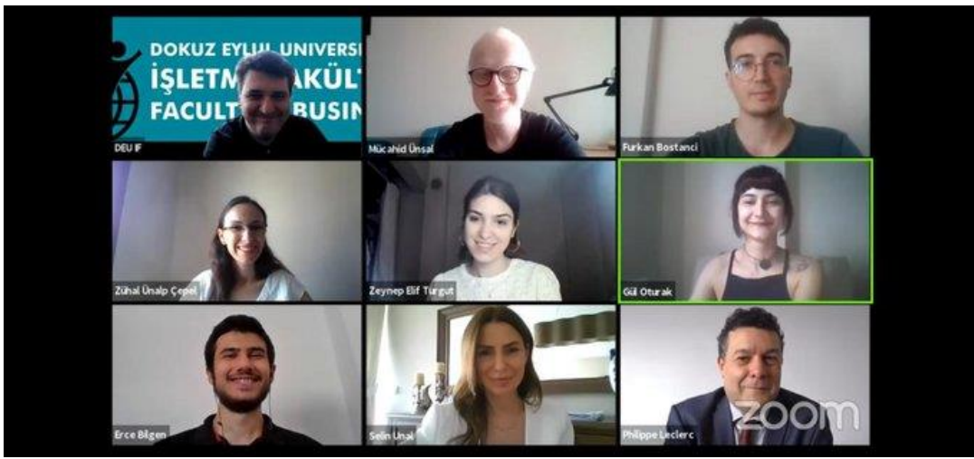
UNHCR Türkiye Temsilcisi ve İzmir Dokuz Eylül Üniversitesi İşletme Fakültesi öğrencileri koruma ve sığınma konularında çevrimiçi bir etkinlikte bir araya geldi.

UNHCR Türkiye Temsilcisi Sn. Leclerc, 27 Mayıs'ta İzmir Dokuz Eylül Üniversitesi İşletme Fakültesi öğrencileriyle çevrimiçi bir etkinliğe katılarak iltica ve uluslararası koruma politikaları, mültecilerin dünyadaki durumu, Türkiye'de uluslararası koruma ihtiyacı içindeki kişiler, UNHCR ve Türkiye Cumhuriyeti Devleti'nin mülteci koruması ve kalıcı çözümler alanlarındaki görevleri hakkında bilgiler aktarmıştır. Leclerc, etkinlikte öğrencilerin sorularını yanıtlarak UNHCR tecrübelerini de paylaşmıştır. Üniversiteyle bir işbirliği protokolü yapılarak Haziran ayında taraflarca imzalanmıştır.