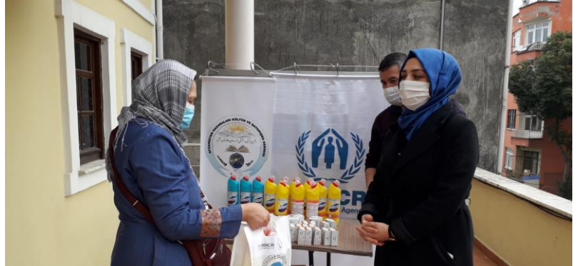
Unilever'in bağışladığı hijyen malzemeleri Trabzon'da ihtiyaç sahiplerine dağıtıldı.

Çok uluslu tedarikçi şirket Unilever'in (Birleşik Krallık) cömertçe bağışladığı hijyen malzemeleri , Türkiye genelinde uluslararası koruma ihtiyacı içindeki yabancılara ve yerel halka dağıtılarak hassas durumdaki kişilerin evlerinde daha hijyenik bir ortamda kalmaları sağlanmıştır. Bu kapsamda 300.000 dezenfektan ve 150.000 sabun UNHCR ortakları üzerinden ihtiyaç sahiplerine ulaştırılmıştır. Unilever'in Türkiye'deki ihtiyaç sahiplerine sağladığı hijyen desteği hakkında detaylı bilgi için tıklayınız .