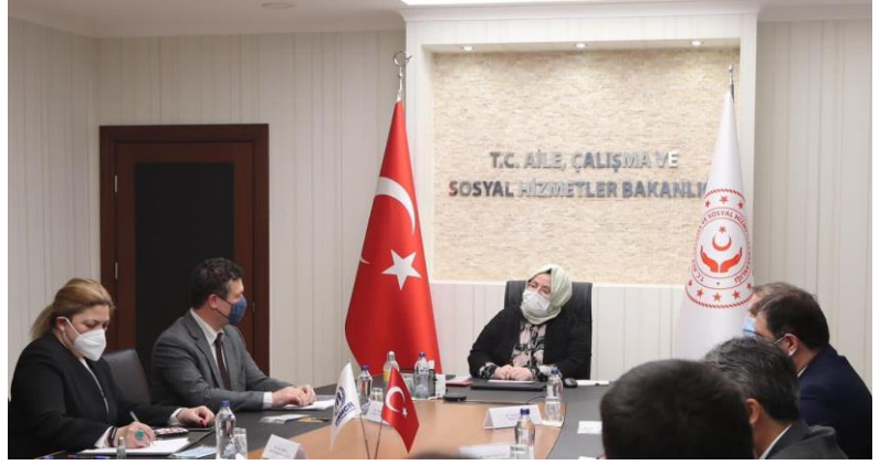
Sn. Zehra Zümrüt Selçuk ve Sn. Philippe Leclerc, Bakanlığa yapılan nezaket ziyaretinde iş birliği çerçevesini görüştü.

UNHCR Türkiye Temsilcisi, Aile, Çalışma ve Sosyal Hizmetler Bakanı Sn. Zehra Zümrüt Selçuk'a 6 Nisan'da nezaket ziyaretinde bulunmuştur. Sn. Bakan, sosyal koruma ve geçim kaynaklarına erişim konularında süregelen işbirliği ve desteğin yanı sıra Türkiye'ye destek konusunda uluslararası toplum nezdinde yapılan savunuculuk çalışmalarından ötürü teşekkürlerini sunmuştur. Toplantıda UNHCR tarafından 2021'de verilecek destek konusu da ele alınmış, Bakanlıkla her türlü iş birliği alanını kapsayacak bir işbirliği protokolünün önümüzdeki dönemde imzalanması konusunda anlaşmaya varılmıştır. UNHCR, geçici ve uluslararası koruma kapsamındaki yabancıların sosyal koruma mekanizmaları kapsamına alınmasına ilişkin ulusal politikanın uygulanması konusunda Bakanlıkla yakın çalışmalarını sürdürmektedir. Bu iş birliği ve destek çerçevesinde koruyucu, önleyici ve destekleyici hizmetlerle birlikte danışmanlık ve rehabilitasyon desteği sağlayan Sosyal Hizmet Merkezlerine, çocuk kuruluşlarına ve Şiddet Önleme ve İzleme Merkezlerine (ŞÖNİM) yönelik kapasite geliştirme çalışmaları yapılıyor. UNHCR, bunun yanı sıra merkezlere personel, araç ve malzeme desteği de sağlıyor.