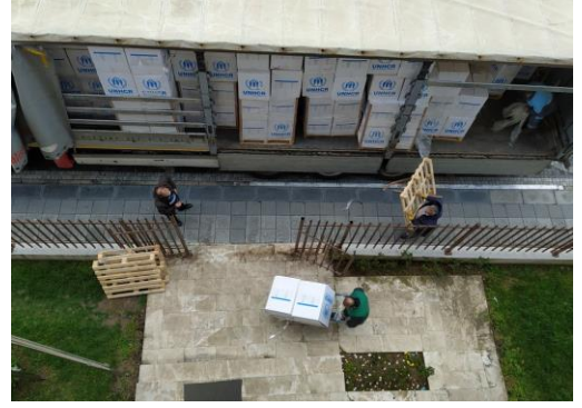
UNHCR, ortakları aracılığıyla Marmara Bölgesi'nde hijyen kitleri dağıtıyor.

Ülke çapında hassas durumdaki gruplara maddi yardımların ve hijyen kitlerinin dağıtımı devam etmektedir. İç Anadolu Bölgesi'nde ihtiyaç sahibi yerel topluma ve uluslararası ve geçici koruma kapsamındaki kişilere yönelik olarak yerel makamlar aracılığıyla 28 ilde hijyen malzemeleri, 30 ilde yatak ve battaniye desteği sürdürülmektedir. Marmara Bölgesi'nde belediye yetkililerinin talepleri üzerine 15 belediyeye hijyen kitlerinin teslimatı tamamlanmıştır. Böylelikle Şubat ile Mart aylarında arasında Marmara Bölgesi'ndeki belediyelere gönderilen toplam hijyen kiti sayısı 42.700'e ulaşmıştır.