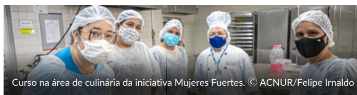
Curso na área de culinária da iniciativa Mujeres Fuertes.

Cerca de 50 empreendedores refugiados e migrantes expuseram seus produtos durante a festa junina municipal de Boa Vista, que ocorreu entre 11 e 18 de junho. O quiosque foi promovido pelo ACNUR em parceria com AVSI, Fraternidade Internacional, Fraternidade Sem Fronteiras, SJMR, Museu A Casa do Objeto Brasileiro, Prefeitura de Boa Vista e Operação Acolhida. Empreendedores venezuelanos também participaram da 3ª edição da Feira IntegraArte, realizada no início de julho no Roraima Garden Shopping.