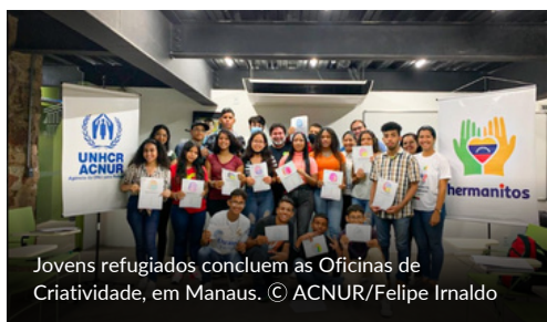
Jovens refugiados concluem as Oficinas de Criatividade, em Manaus.