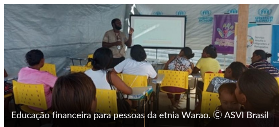
Educação financeira para pessoas da etnia Warao.

Com o objetivo de desenvolver o protagonismo das pessoas refugiadas e migrantes que buscam inserção no mercado de trabalho, foram realizados cinco treinamentos em educação financeira, com um total de 81 participantes. Duas sessões foram especificamente para os artesãos indígenas residentes no Abrigo Waraotuma a Tuaranoko, em Boa Vista (RR).