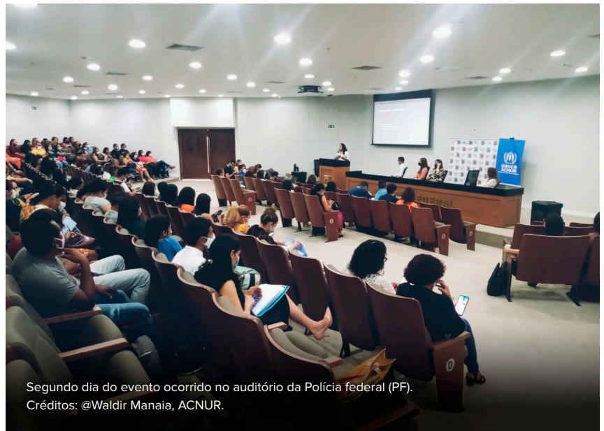
Segundo dia do evento ocorrido no auditório da Polícia federal (PF).

Nos dias 28 e 29 de abril, o ACNUR e a Secretaria de Justiça e Direitos Humanos (SEJUDH) realizaram no auditório da Superintendência da Polícia Federal do Pará uma formação para as redes protetivas de 15 municípios paraenses. Nos dois dias de evento, cerca de 140 participantes tiveram a oportunidade de conhecer e debater temas relativos a marcos jurídicos, documentação, acesso à justiça e assistência para acesso a moradia segura voltada a população de pessoas refugiadas. O evento contou com a contribuição de órgãos parceiros do ACNUR como a Delegacia de Migrações (DELEMIG), a Coordenação Geral do CONARE (CG-CONARE), Defensorias Públicas do Estado e da União e Ministério Público do Pará (MPPA).