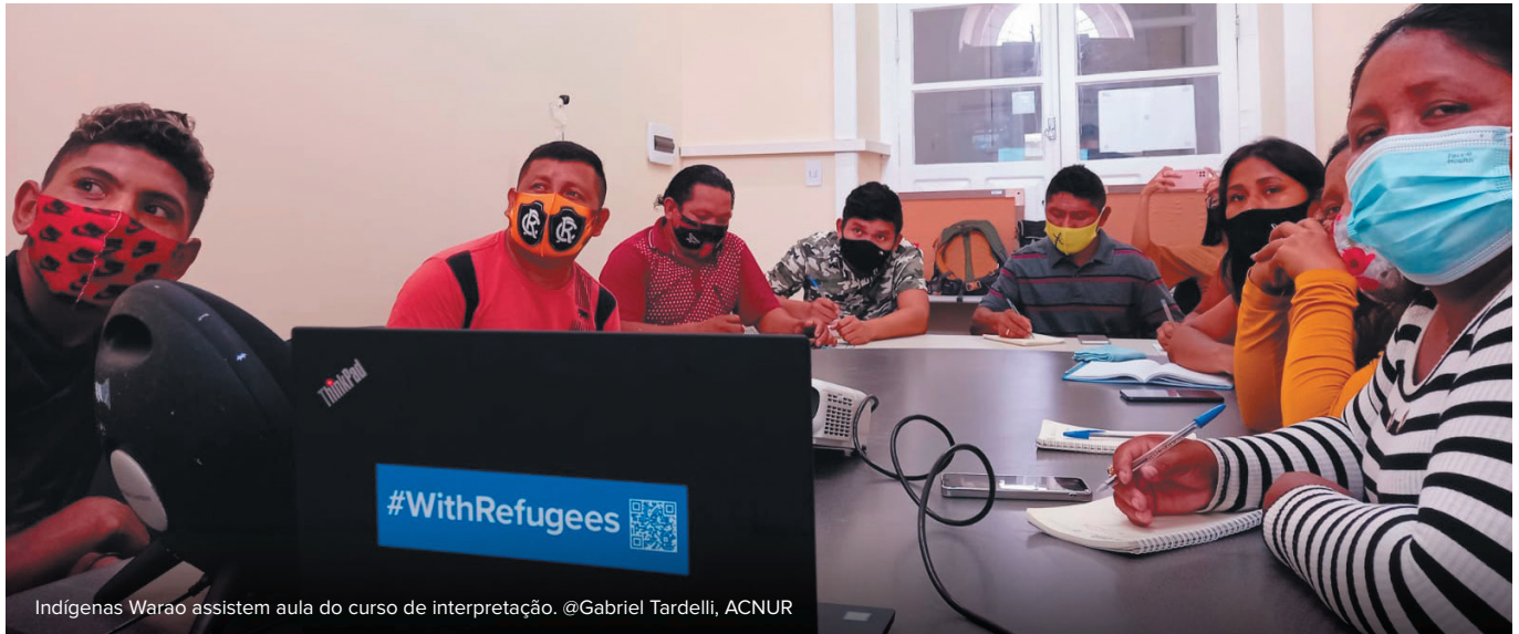
Indígenas Warao assistem aula do curso de interpretação.