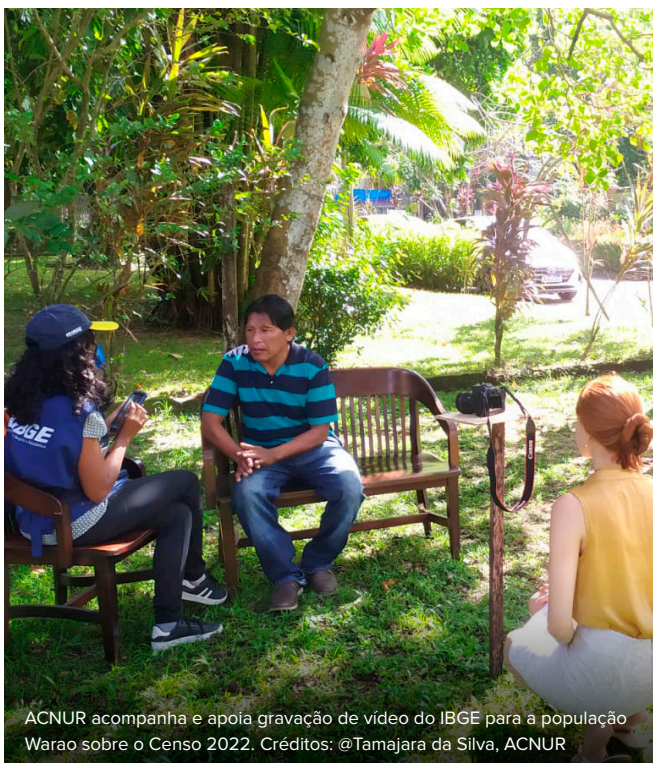
ACNUR acompanha e apoia gravação de vídeo do IBGE para a população Warao sobre o Censo 2022.

Nos dias 4, 5 e 12 de maio, o ACNUR, em parceria com a Secretaria Estadual de Segurança Pública (SEGUP) e a Diretoria de Polícia Comunitária e Direitos Humanos da Polícia Militar, capacitou 270 agentes das forças de segurança pública do Pará por meio de treinamentos remotos. Entre os assuntos abordados estavam o mandato do ACNUR, os principais marcos normativos sobre refúgio, além de aspectos históricos e antropológicos referentes ao povo Warao. As formações, voltadas tanto para agentes que estão na linha de frente no atendimento do público de pessoas refugiadas no Estado quanto delegados e oficiais gestores das Forças, focaram em identificar medidas conjuntas que busquem promover a segurança e prevenir situações de violência contra pessoas refugiadas e migrantes que residem no Pará, em especial os indígenas venezuelanos da etnia Warao.