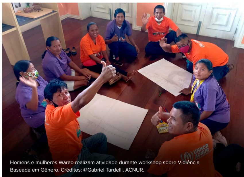
Homens e mulheres Warao realizam atividade durante workshop sobre Violência Baseada em Gênero.

No dia 3 de maio, o ACNUR em conjunto com o Instituto Internacional de Educação do Brasil (IEB), a Defensoria Pública da União (DPU) e a Defensoria Pública do Estado do Pará (DPE), deu início ao segundo módulo da Escola de Lideranças Indígenas Warao. Durante as aulas, realizadas no Centro Universitário do Pará (CESUPA), os Warao tiveram a oportunidade de aprender um pouco mais sobre questões relacionadas ao acesso à justiça, terra e moradia. No total, foram contemplados 25 indígenas, entre homens e mulheres de diferentes idades. As aulas aconteceram nos meses de maio e junho e, além dos encontros presenciais, a metodologia envolveu atividades de Tempo Comunitário, permitindo que os alunos realizassem ações em suas próprias comunidades colocando em prática o que foi discutido em sala de aula.