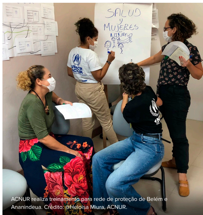
ACNUR realiza treinamento para rede de proteção de Belém e Ananindeua.

Entre março e abril de 2022, a Coordenação-Geral do Comitê Nacional para os Refugiados (CG-CONARE), com o apoio do ACNUR, realizou entrevistas remotas com 8 indígenas Warao que não possuem documento do país de origem com o objetivo de atestar sua nacionalidade e permitir, assim, que possam ser contemplados pelo processo simplificado de reconhecimento da condição de refugiado. Esta foi a primeira vez que indígenas Warao participaram de entrevistas online com o CG-CONARE em mais uma iniciativa inovadora do ACNUR em Belém. Considerando que a mobilidade urbana é desafiadora e um obstáculo para a população Warao vivendo longe do centro de Belém, as entrevistas aconteceram no Centro de Referência e Assistência Social (CRAS) do bairro do Outeiro, onde os entrevistados vivem, o que facilitou o acesso e comparecimento às entrevistas. Como resultado das entrevistas virtuais, até junho de 2022, 7 já foram reconhecidos como refugiados pelo CONARE e poderão acessar também os direitos garantidos a pessoas refugiadas reconhecidas no Brasil, tais como acesso a residência permanente e naturalização após 4 anos, extensão dos efeitos da condição de refugiado e flexibilização nas exigências de apresentação de documentos do país de origem.