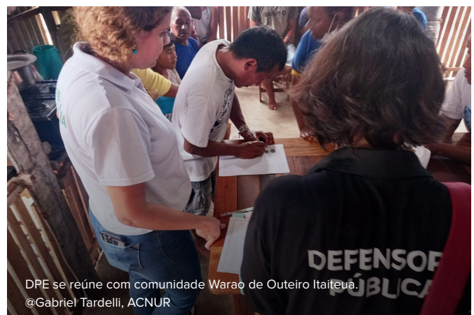
DPE se reúne com comunidade Warao de Outeiro Itaitua.

No dia 21 de junho, no marco das celebrações do Dia Mundial do Refugiado, foi aprovado por unanimidade pela Assembleia Legislativa do Pará (ALEPA) o Projeto de Lei que estabelece a política estadual para migrantes, refugiados e apátridas e dispõe sobre seus objetivos, princípios, diretrizes e ações prioritárias. O ACNUR brindou assistência técnica para a discussão do projeto de lei durante audiência pública e, em parceria com o IEB, promoveu um encontro para debater o projeto com lideranças indígenas Warao, os quais tiveram seus comentários inseridos no texto final aprovado pela ALEPA. No dia 12 de Julho, a lei foi sancionada pelo Governo do estado do Pará.