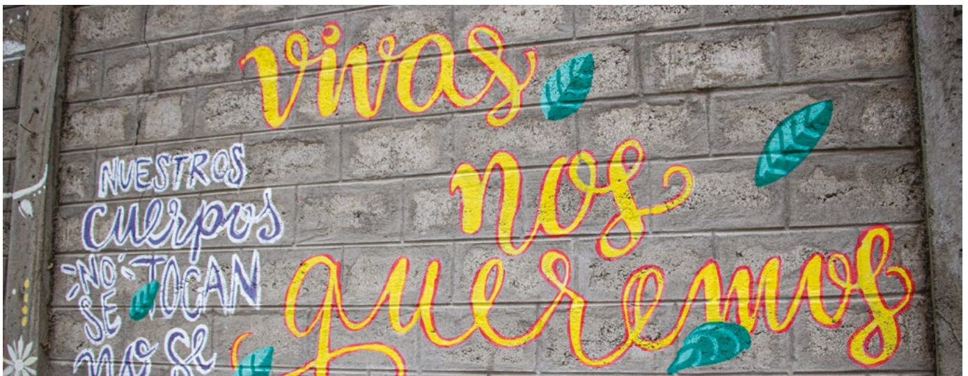
📷 Mensajes escritos por mujeres sobrevivientes de la violencia sexual y de género decoran los muros de la casa de acogida Cotopaxi, que ofrece alojamiento seguro a refugiados y mujeres ecuatorianas en la ciudad de Salcedo (Ecuador).

Además, hemos emprendido un examen exhaustivo de las herramientas disponibles para ofrecer apoyo y asistencia a testigos y víctimas. Esto servirá como base para el reconocimiento y desarrollo de las buenas prácticas.