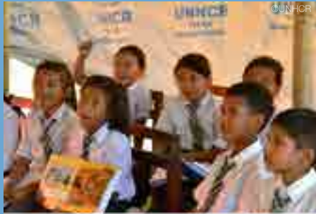
"พวกหนูดีใจที่ได้กลับมาเรียน และเล่นกับเพื่อนที่โรงเรียนอีกครั้ง" เด็กๆจากโรงเรียนมัธยม สรวงเงิน บริภูมิที่ถูกทำลายยับเยินจากเหตุแผ่นดินไหวถล่ม