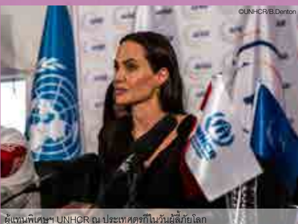
ผู้แทนพิเศษฯ UNHCR ณ ประเทศตุรกีในวันผู้ลี้ภัยโลก

UNHCR ประเทศไทย ร่วมกับพันธมิตร และผู้ลี้ภัย จัดกิจกรรมฉลองวันผู้ลี้ภัยโลกในวันที่ 20 มิถุนายนที่ผ่านมา ณ ค่ายผู้ลี้ภัยทั้ง 9 ค่าย เพื่อรำลึกถึงความเข้มแข็งของผู้ลี้ภัย และเป็นกำลังใจให้ผู้ลี้ภัยในค่าย โดยกิจกรรมทั้ง 9 ค่ายมีความสนุกสนาน และหลากหลายแตกต่างกันไป อาทิ แสดงฟ้อนรำท้องถิ่น ระบายสี ร้องเพลง ซึ้งหลังวิ่งแข่ง และตัดผมฟรี