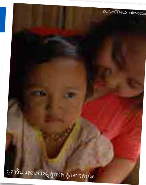
มูราวิน และแอเดมคูพอล ลูกสาวคนโต

เมื่อถามถึงของมีค่าที่เธอจะเอาติดตัวไปที่ประเทศอเมริกาด้วย เธอตอบว่า “ของของลูก”