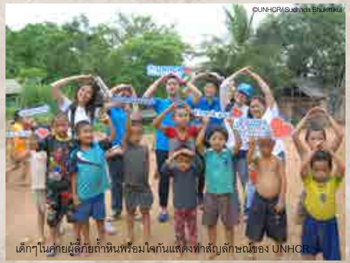
เด็กๆ ในค่ายผู้ลี้ภัยถ้ำหินพร้อมใจกันแสดงทำสัญลักษณ์ของ UNHCR

เราขอเป็นตัวแทนของผู้ลี้ภัยในการแสดงความขอบคุณน้ำใจอันยิ่งใหญ่ของท่าน เพราะท่าน UNHCR จึงสามารถให้ความคุ้มครองและความช่วยเหลือแก่ผู้ลี้ภัยให้เดินทางต่อไป