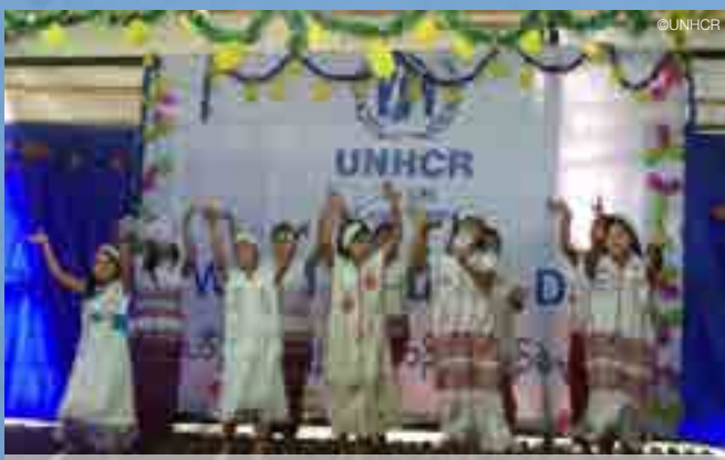
เด็ก ๆ ผู้ลี้ภัยที่ค่ายผู้ลี้ภัยถ้ำหิน จ.ราชบุรี แสดงการฟ้อนรำท้องถิ่น