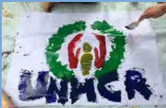
เด็ก ๆ ที่ค่ายผู้ลี้ภัยบ้านใหม่ในสอย จ.แม่ฮ่องสอน ร่วมระบายสีในกิจกรรมวันผู้ลี้ภัยโลก