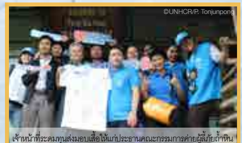
เจ้าหน้าที่ระดมทุนส่งมอบเสื้อให้แก่ประธานคณะกรรมการค่ายผู้ลี้ภัยถ้ำหิน

UNHCR จัดบูรณะระดมทุน และกิจกรรมเขียนข้อความบนเสื้อเพื่อให้กำลังใจผู้ลี้ภัยในค่าย ล่าสุด ห้องสรรพสินค้าเอ็มควอเทียร์ได้ให้การสนับสนุนพื้นที่ตั้งบูธและจัดกิจกรรมดังกล่าว โดยได้รับการตอบรับจากลูกค้าของห้างฯ เป็นอย่างดี