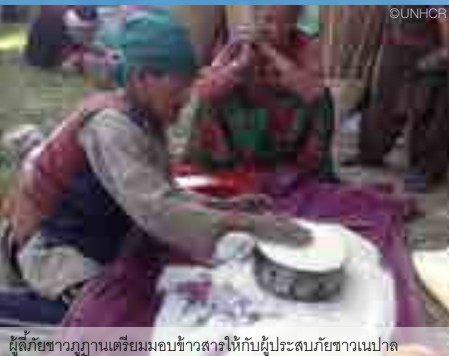
ผู้ลี้ภัยชาวภูฏานเตรียมมอบข่าวสารให้กับผู้ประสบภัยชาวเนปาล