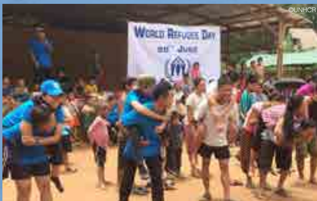
ผู้ลี้ภัย และเจ้าหน้าที่ UNHCR เข้าร่วมกิจกรรมซึ้งหลังวิ่งแข่ง ณ ค่ายบ้านต้นยาง จ.กาญจนบุรี