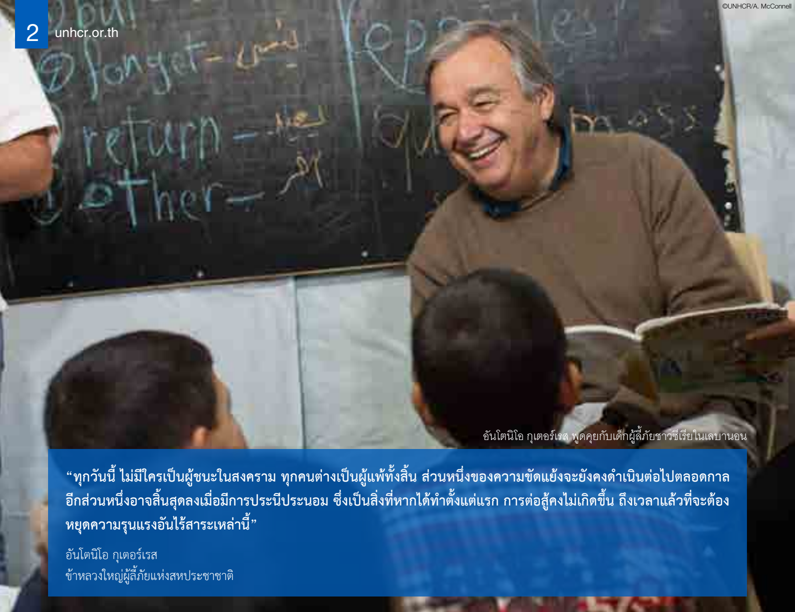
อันโตนิโอ กูเตอร์เรส พูดคุยกับเด็กผู้ลี้ภัยชาวซีเรียในเลบานอน

“ทุกวันนี้ ไม่มีใครเป็นผู้ชนะในสงคราม ทุกคนต่างเป็นผู้แพ้ทั้งสิ้น ส่วนหนึ่งของความขัดแย้งจะยังคงดำเนินต่อไปตลอดกาล อีกส่วนหนึ่งอาจสิ้นสุดลงเมื่อมีการประนีประนอม ซึ่งเป็นสิ่งที่หากได้ทำตั้งแต่แรก การต่อสู้คงไม่เกิดขึ้น ถึงเวลาแล้วที่จะต้องหยุดความรุนแรงอันไร้สาระเหล่านี้” อันโตนิโอ กูเตอร์เรส ข้าหลวงใหญ่ผู้ลี้ภัยแห่งสหประชาชาติ