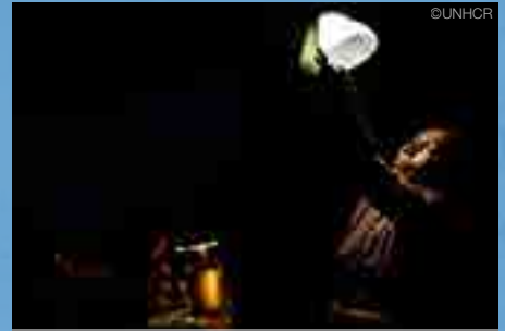
"โคมไฟพลังงานแสงอาทิตย์กลายเป็นสมบัติอันล้ำค่าของฉัน" หญิงผู้รอดชีวิตจากเหตุแผ่นดินไหวที่รุนแรงที่สุดในรอบ 80 ปีที่เนปาลกล่าว