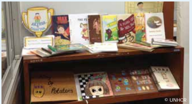
มุมอ่านหนังสือของผู้ลี้ภัย Reading corner for asylum seekers and refugees

In February, IKEA launched a good cause campaign in support of UNHCR. For every LEDARE light bulb sold during the campaign period, the IKEA Foundation will donate one Euro to UNHCR. The funds generated will help improve access to lighting, renewable energy and primary education in Ethiopia, Sudan, Chad, Bangladesh and Jordan – improving these communities for the children and families who live there.