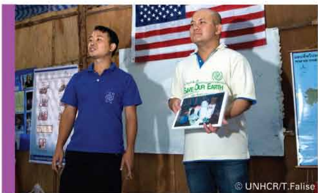
การประชุมเพื่อเตรียมความพร้อมสำหรับผู้ลี้ภัยที่ได้รับอนุญาตให้ตั้งถิ่นฐานในต่างประเทศ

สำนักงานยูเอ็นเอชซีอาร์ในประเทศไทย สามารถดำเนินการให้ผู้ลี้ภัยตั้งถิ่นฐานในต่างประเทศได้มากที่สุดทั่วโลก ตั้งแต่ปี 2548 ยูเอ็นเอชซีอาร์ได้ช่วยเหลือให้ผู้ลี้ภัยจากประเทศมากกว่า 50,000 คน ได้เดินทางออกจากประเทศไทย เพื่อเริ่มต้นชีวิตใหม่ในต่างประเทศ อาทิ สหรัฐอเมริกา แคนาดา ออสเตรเลีย โดยคาดว่า ภายในสิ้นปีนี้จะสามารถช่วยเหลือผู้ลี้ภัยได้รับสิทธิในการตั้งถิ่นฐานในประเทศที่สามได้อีกจำนวน 7,000 คน การตั้งถิ่นฐานถือเป็นวิธีการให้ความคุ้มครองที่สำคัญสำหรับผู้ลี้ภัย เป็นการเปิดโอกาส และสร้างอนาคตใหม่แก่ผู้ลี้ภัยซึ่งอยู่ในสภาพไร้ความหวังเป็นเวลากว่า 20 ปีในพื้นที่ที่พักพิงชั่วคราว