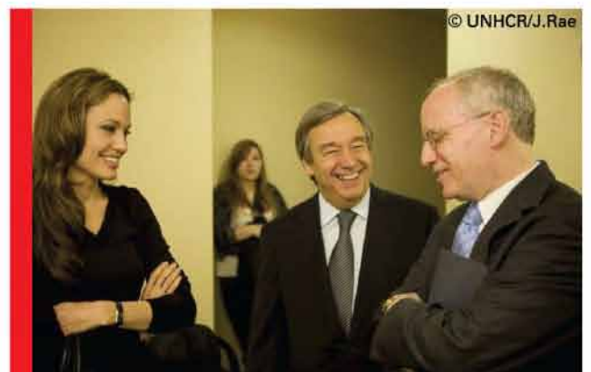
แองเจลิน่า โจลี่ ทูตสันถวไมตรีของยูเอ็นเอชซีอาร์ และ แอนโทนีโอ กูเตอเรส ข้าหลวงใหญ่ผู้ลี้ภัยสหประชาชาติในงานวันผู้ลี้ภัยโลกที่เมืองวอชิงตัน ดี.ซี.

ยูเอ็นเอชซีอาร์ ร่วมกับบริษัท ทูร วิชั่นส์ จำกัด (มหาชน) ประชาสัมพันธ์สปอตโทรทัศน์ความยาว 30 วินาที ซึ่งเป็นคำกล่าวของดาราสาว แองเจลิน่า โจลี่ ทูตสันถวไมตรีของยูเอ็นเอชซีอาร์ เนื่องในวันผู้ลี้ภัยโลก ซึ่งตรงกับวันที่ 20 มิ.ย. ของทุกปี บ.ทูร วิชั่นส์ จะได้ออกอากาศสปอตดังกล่าวระหว่างวันที่ 15-30 มิ.ย.ที่ผ่านมา ใน 6 ช่องรายการ ได้แก่ TNN2, True Series, True Inside, True Movies Hits, True X-Zyte และ True Film Asia