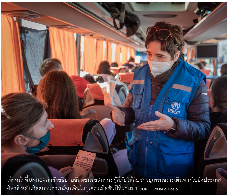
เจ้าหน้าที่ UNHCR กำลังอธิบายขั้นตอนขอสถานะผู้ลี้ภัยให้กับชายผู้ลี้ภัยบนรถไฟไปยังประเทศอิตาลี หลังเกิดสถานการณ์ฉุกเฉินในยูเครนเมื่อต้นปีที่ผ่านมามี

ทุกช่วงเวลาของผู้ที่ถูกบังคับให้พลัดถิ่นต้องการความคุ้มครองไม่ว่าภัยคุกคามจะเกิดจาก สงคราม ความรุนแรง หรือการประหารชีวิตเพราะพวกเขา มีสิทธิที่จะแสวงหาความคุ้มครองเพื่อให้ได้รับความปลอดภัย