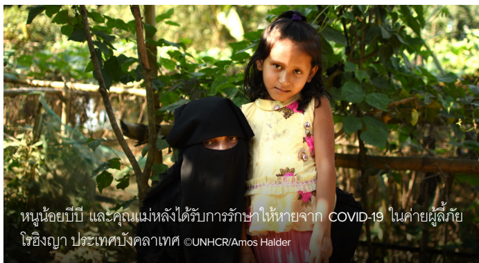
หนูน้อยบีบี และคุณแม่หลังได้รับการรักษาให้หายจาก COVID-19 ในค่ายผู้ลี้ภัยโรฮิงญา ประเทศบังคลาเทศ

Refugees and the host community in South Sudan work together to make clean, sustainable fuel.