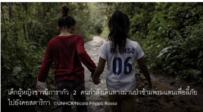
เด็กผู้หญิงชาวนิการากัว 2 คนกำลังเดินทางผ่านป่าข้ามพรมแดนเพื่อลี้ภัยไปยังคอสตาริกา

การเปิดพรมแดนชั่วคราวเป็นสิ่งสำคัญเพื่อช่วยเหลือทุกชีวิตที่ต้องแสวงหาความปลอดภัยอย่างเร่งด่วน การจำกัดการข้ามพรมแดนอาจทำให้การเดินทางของผู้ลี้ภัยที่เปราะบางเกิดอันตรายได้