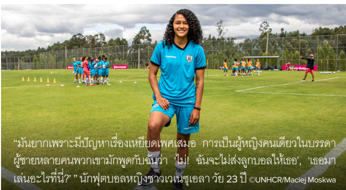
“มันยากเพราะมีปัญหาเรื่องเหยียดเพศเสมอ การเป็นผู้หญิงคนเดียวในบรรดาผู้ชายหลายคนพวกเขามักพูดกับฉันว่า ‘ไม่! ฉันจะไม่ส่งลูกบอลให้เธอ’, ‘เธอมาเล่นอะไรที่นี่?’” นักฟุตบอลหญิงชาวเวเนซุเอลา วัย 23 ปี

Fahima, a Syrian refugee, and her family have experienced difficulties again after their home in Beirut, Lebanon, was destroyed by the recent blast.