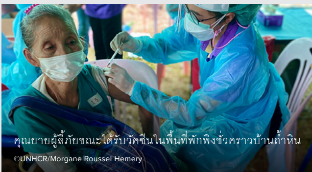
คุณยายผู้ลี้ภัยขณะได้รับวัคซีนในพื้นที่พักพิงชั่วคราวบ้านถ้ำหิน