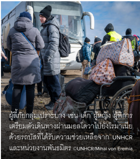
ผู้ลี้ภัยกลุ่มเปราะบาง เช่น เด็ก ผู้หญิง ผู้พิการ เตรียมตัวเดินทางผ่านมอลโดวาไปยังโรมาเนีย ด้วยรถบัสที่ได้รับความช่วยเหลือจาก UNHCR และหน่วยงานพันธมิตร