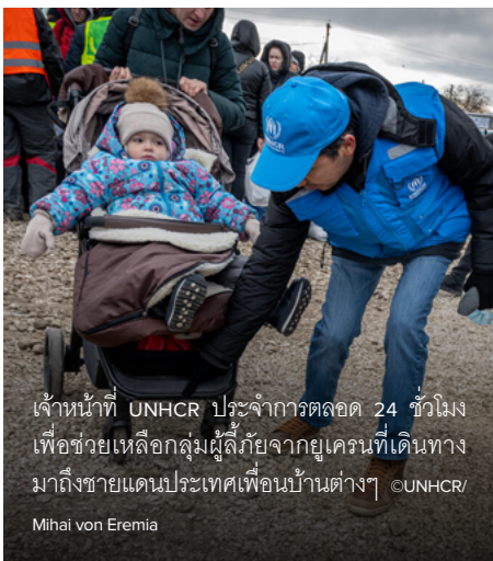
เจ้าหน้าที่ UNHCR ประจำการตลอด 24 ชั่วโมง เพื่อช่วยเหลือกลุ่มผู้ลี้ภัยจากยูเครนที่เดินทางมาถึงชายแดนประเทศเพื่อนบ้านต่างๆ