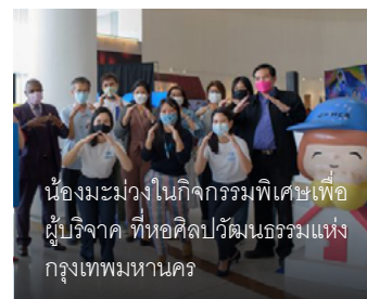
น้องมะม่วงในกิจกรรมพิเศษเพื่อผู้บริจาค ที่หอศิลปวัฒนธรรมแห่งกรุงเทพมหานคร